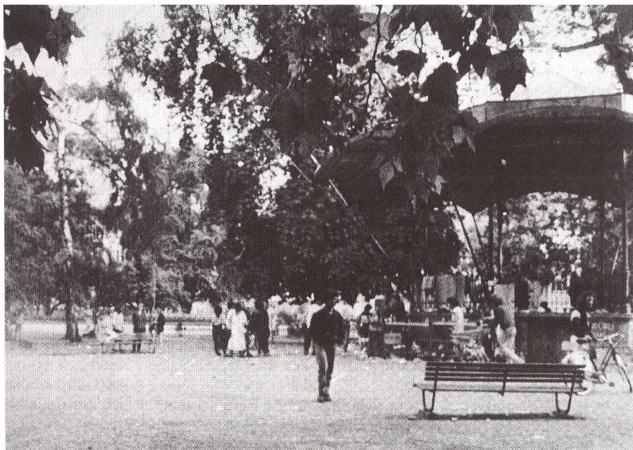
Die aktuelle Zürcher Drogenszene am Platzspitz.