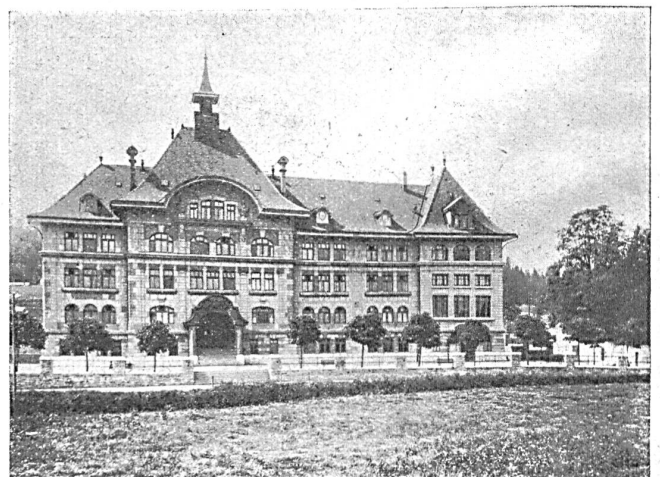
Höhere Handelsschule La Chaux-de-Fonds