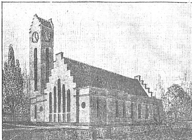
Entwurf des Fünfklässlers P. T. für eine Kirche.