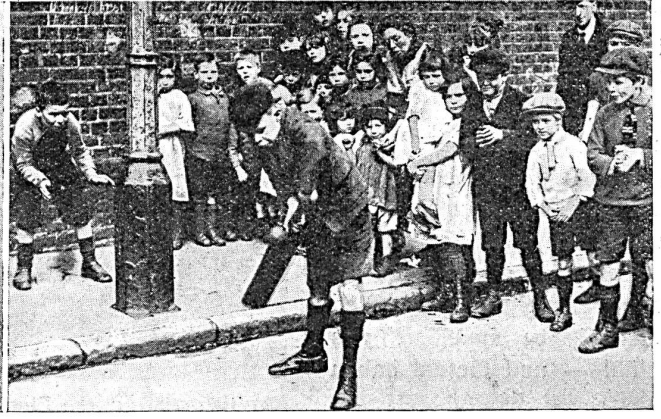
Sport im East End

sächlich befindet. Die jüngste Generation verspricht darum wohl einheitlicher und ausgeglichener erzogen zu werden als die Generationen, die hinter uns liegen. Dem Sport als Mittel zur Erziehung wird dabei durch die Demokratisierung der Spiele noch grössere Bedeutung zukommen als bisher.