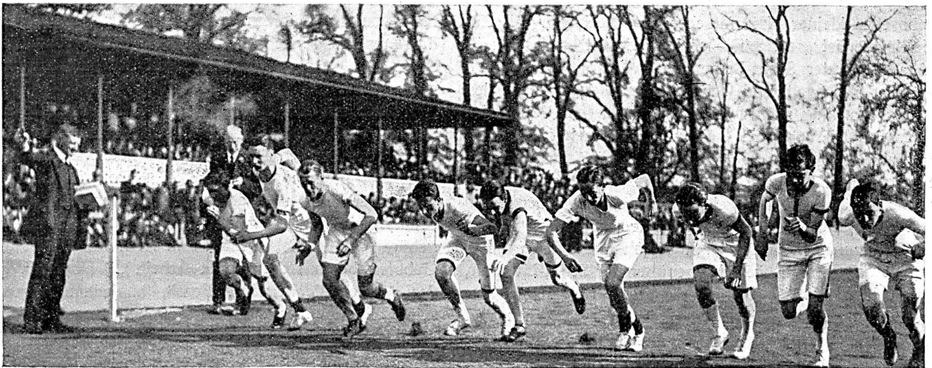
Start zum Wettlauf zwischen ehemaligen (Old Citizens) und jetzigen Schülern der City of London School

man nicht an eine verrückte Rekordwut der Jungens denken. Das gibt es auch, und wenn Eton gegen Harrow spielt, so ist das schlechthin Krieg, ein Krieg mit Heldentaten, mit Hass und mit Liebe. Aber im Grunde ist der Schulsport nur ein köstliches, fröhliches Spiel, ein Spiel mit Bällen und Farben. Man muss die feierlichen jungen Herrn mit ihren schwarzen Röcken und Zylinderhüten oder die Collegers mit ihrem Gelehrtenmäntelchen auf dem Spielplatz sehen, um sie zu verstehen — und zugleich um zu begreifen, was trotz allem das Verständigungsmittel zwischen Volksschülern und Etonboys ist. Auf dem Spielplatz fällt die schwarze Hülle — und ein höchst munterer, flinker, schlanker Junge läuft übers Feld. Hier ist alles Leben und alles Farbe. Die Farben, die „Colours“, sind die Geheimsprache der Boys. Die „Colours“, die Erringung des Rechts, diese oder jene Mütze oder Farbe tragen zu dürfen, sind ihr Ehrgeiz. Es sind mysteriöse Dinge. Der Laie erkennt nur ein entzückendes Bild von unzähligen bunten Mützen, Halstüchern, Hemden, Wolljacken, Strümpfen. Für die, die sie