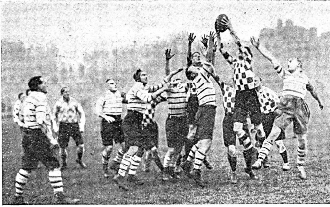
Spannender Moment (a line out) aus dem Rugby Cup in Richmond