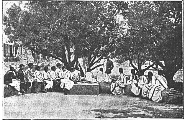
Unterrichtsstunde in Santiniketan

Eine grosse Anzahl Fresken und Oelgemälde in den Lehrräumen der Anstalt stammt von jungen Künstlern der Kalabhavana.