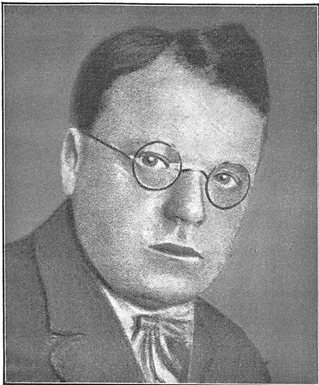
Univ.-Prof. Dr. Josef Nadler, Königsberg

Druckgewerbe 1\frac{1}{2} ‰, in Giessereien und Maschinenfabriken 4 ‰, in der Schuhindustrie etwa 1 ‰, und im Steinbruchgewerbe rund 13 ‰ der Arbeiter nach dem Fünftage-Schema.