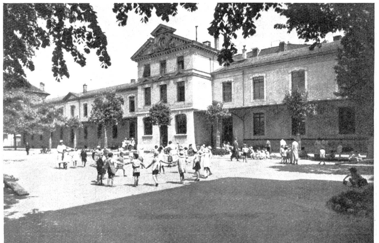
Institut J. J. Rousseau (ehemaliges Primarschulgebäude der Gemeinde Plainpalais) mit Hof, wo die Kinder des „Hauses der Kleinen“ spielen

Der dritte war ausschließlich den rechtlichen Belangen des Jugendrechtes, namentlich auch im Hinblick auf das gegenwärtig im Wurfe befindliche neue Jugendrecht für den Kanton Genf, und des Jugendrechtes, wie es im Entwurf zum Schweizerischen Strafrecht, Art. 80—96, vorgesehen ist, gewidmet. Dann aber auch der verwaltungsrechtlichen und prozessuellen Gliederung dieses Rechtes, sowie seiner innigen Beziehungen zur einzig vernünftigen Jugendfürsorge, für die ausschließlich das Wohl der heranwachsenden Jugend, ihre bestmögliche Erziehung, ihre weitgehendste Ertüchtigung fürs Leben, ihre Eingliederung in Staat und Gesellschaft in Frage kommen darf.