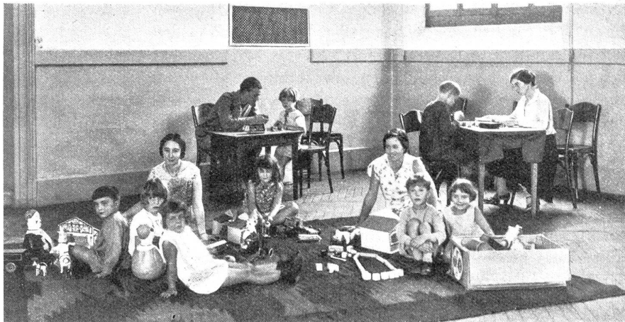
Im „Wartezimmer“ der medizinisch-pädagogischen Sprechstunde wird gespielt, was Anlaß zu mannigfaltigen psychologischen Beobachtungen gibt

Daß sich eine derartige Anstalt zur Ausbildung von ganz besonders befähigten Erziehungsfachleuten in hervorragender Weise eignet, versteht sich von selbst, wird aber auch durch den Umstand erhärtet, daß es zu jeder Zeit von Studierenden aller