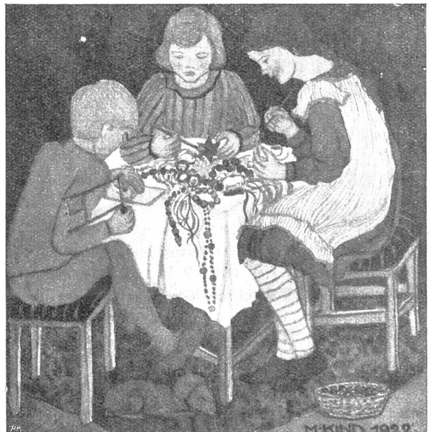
Arbeit einer 13-jährigen Schülerin aus der Jugendkunstklasse Prof. Cizeks. (Veröffentlicht in der JRK-Zeitschrift, Wien)

Zum Kapitel Jugendrotkreuz-Zeitschrift, die ja auch in einigen hunderten Schulen in der Schweiz bekannt ist: Wir bieten hier dem Kind einmal nichts „für das Kind Geschriebenes oder Gezeichnetes“, sondern echte Kunst, zunächst selbstverständlich die des eigenen Volkes (es gibt keinen andern Weg zur Menschheit als über das eigene Volk), aber das Beste in Dichtung und Malerei, womöglich auch Musik aus andern Kulturen soll auch den Kindern nahegebracht werden. Viele haben zum Beispiel unser Schwedenheft oder