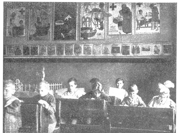
Eine Wiener Jugendrotkreuzklasse beim Schülerbriefwechsel

Es hat natürlich schon vor dem Jugendrotkreuz einen Schülerbriefwechsel gegeben. Er war aber fast immer individuell. Nur ein Kind hat davon etwas gehabt, und die Erfahrung hat gezeigt, daß dieser individuelle Briefwechsel sehr oft eingeschlafen ist oder Formen angenommen hat, die pädagogisch nicht zu vertreten waren. Aber ein Briefwechsel von Klasse zu Klasse, ja nicht pedantisch oder langweilig, sondern lebendig (wenn es sein muß auch mit den orthographischen Fehlern in den Briefen), mit Zeichnungen usw. — er kann für eine Klasse zum Erlebnis werden. Daß ein gut geführter Briefwechsel fast alle Gegenstände befruchtet, daß er keine Belastung, sondern eine Hilfe für den Unterricht ist, versteht sich von selbst.