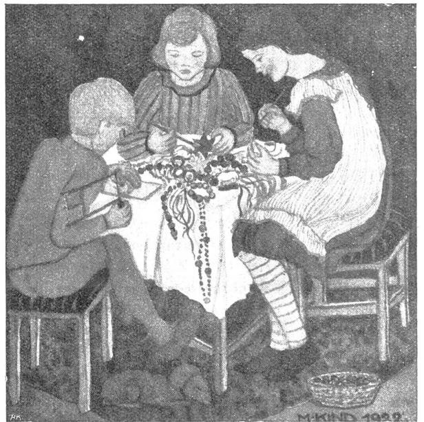
Arbeit einer 13-jährigen Schülerin aus der Jugendkunstklasse Prof. Cizeks. (Veröffentlicht in der JRK-Zeitschrift, Wien)

Zum Kapitel Jugendrotkreuz-Zeitschrift, die ja auch in einigen hunderten Schulen in der Schweiz bekannt ist: Wir bieten hier dem Kind einmal nichts „für das Kind Geschriebenes oder Gezeichnetes“, sondern echte Kunst, zunächst selbstverständlich die des eigenen Volkes (es gibt keinen andern Weg zur Menschheit als über das eigene Volk), aber das Beste in Dichtung und Malerei, womöglich auch Musik aus andern Kulturen soll auch den Kindern nahegebracht werden. Viele haben zum Beispiel unser Schwedenheft oder