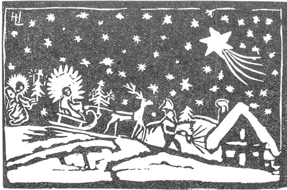
Weihnachtskarte eines Schülers in Feldkirch (Vorarlberg). In einer Stunde entworfen und geschnitten. (Linolschnitt). (Aus dem Weihnachtsheft 1932 der Jugendrotkreuz-Zeitschrift)

„Gesundheitsspiel“ gesunde Lebensführung gebracht. Zum Beispiel die Regel „Ich habe heute keinen Alkohol getrunken“. Sie wird auch manche Väter stutzig machen. Das Fenster, oder im strengsten Winter der Spalt des Fensters, der vom Kind am Abend geöffnet wird, er wird in den meisten Fällen der ganzen Familie frische Luft zuführen usw. Man mache mit dem „Gesundheitsspiel“ einen Versuch.