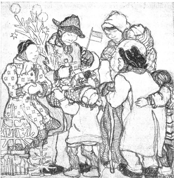
Arbeit einer 12-jährigen Schülerin aus der Jugendkunstklasse Prof. Cizeks. (Veröffentlicht in der JRK-Zeitschrift, Wien)

Bald nach der Gründung des österreichischen Jugendrotkreuzes schritten wir zur Ausgabe einer eigenen Jugendrotkreuz-Zeitschrift . Und da ist uns nun etwas Angenehmes und zugleich Unangenehmes passiert. Die Zeitschrift wurde so gut, daß tausende Schulen — zuerst nur in Österreich, dann auch im übrigen Mitteleuropa und später sogar in Übersee — begeistert nach ihr griffen und sie als Klassenlesestoff hielten. Damit war natürlich eine Beeinflussung der Kinder möglich, wie sie sich manche kaum erträumt hatten. 70 000 war vor der ungeheuren Krise die Auflage und bei manchen Heften sogar 90 000. Das war die angenehme Seite! Aber die Kehrseite: Manche identifizierten einfach das Jugendrotkreuz mit der Jugendrotkreuz-Zeitschrift. Hörten die Leute das Wort Jugendrotkreuz, so war oft die auto-