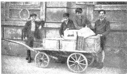
„Obst an die Bergschulen.“ Jugendrotkreuzkinder in Mauer bei Wien, bei der Beförderung des Obstes auf die Bahn

In den meisten Ländern lautet der Wahlspruch des Jugendrotkreuzes: „Ich diene“; also praktische Nächstenliebe, Hilfsbereitschaft. Fast immer kommen die prächtigsten Vorschläge von den Kindern. So einfallreich kann kaum ein Erwachsener sein. In hundert Formen wird „gedient“. Jugendrotkreuz-Gruppen suchen Altersheime auf, um alten, müden Menschen ein paar sonnige Stunden durch Tanz, Lied und Spiel zu verschaffen. Österreichische Jugendrotkreuz-Gruppen führen (nach Schweizer Vorbild) seit vier Jahren die Aktion „Obst an die Bergschulen“ durch. (Nebenbei: eine vorzügliche, weil indirekte Aktion gegen den Alkohol.) Zu Weihnachten gehen Liebesgaben-Sendungen an arme Schulen. (Auch heuer werden — trotz der ungeheuren Krise — die amerikanischen Jugendrotkreuz-Kinder etwa 100 000 Päckchen zu Weihnachten in alle Welt senden.) Im Vorjahr war es möglich, alle Arbeitslosenkinder von Bleiberg in Kärnten zu betreuen. Nachhilfeunterricht