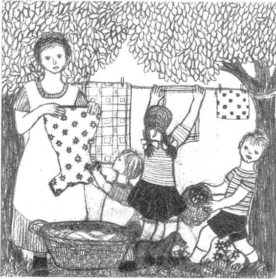
Zum „Muttertag“. Arbeit einer 13jährigen Schülerin aus der Jugendkunstklasse Prof. Cizeks. (Veröffentlicht in der JRK-Zeitschrift, Wien)

dafür eintritt, nur vegetierend dort, wo ihm aus irgendwelchen Gründen die freudige Mitarbeit der Lehrerschaft versagt bleibt. Es kann ohne Übertreibung gesagt werden: Aus zehntausenden, vielleicht hunderttausenden Schulen auf Erden — auch aus einigen tausend österreichischen Schulen — ist das Jugendrotkreuz nicht mehr fortzudenken.