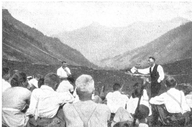
Das letzte Wort des Bündner Bauern

Doch Sie sehen auch das Auseinandergerissenwerden in den Familien der Wohlhabenden und Reichen. Die wichtigsten Maßnahmen zur Erhaltung und Belebung der Familien bestehen eben nicht in staatlichen Einrichtungen und wirtschaftlichen Erleichterungen, sondern in Seelenlage und Seelentätigkeit der Menschen. Das frühe Erleben des Zusammenhangs im Geschwisterkreis erzieht den Menschen zu der so nötigen Einordnung in das Volksganze. Die älteren Geschwister sind ihren jüngeren Brüdern und Schwestern gegenüber schon die Helfenden. Daß einer sich beschränkt weiß durch die äußeren Verhältnisse seiner Familie, macht ihn stark zum Neinsagen gegenüber allerhand Gelüsten. Bindungen an Gewohnheiten und gute Sitten bilden zuverlässige Menschen heran, verhindern die Auswüchse im Zusammenleben der Menschen und verleihen besondern Rückhalt im Verkehr der Geschlechter untereinander. Die Freude an etwas wirklich Schönerm gibt vielen die innere Kraft, deren sie Tag für Tag bedürfen, wo andere, ewig unbefriedigt, von Genuß zu Genuß jagen.