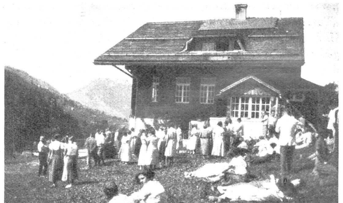
Nach dem Vortrag, die richtige Diskussion von Mund zu Mund, von Herz zu Herz

Sie spüren: die Heimat sind nicht Berg und Tal allein; es sind die Menschen, die sie beleben. Die Menschen aber treffen Sie vor allem in der Familie . Deshalb versteht es sich von selbst, daß wir in der Heimatwoche zuerst von Ehe und