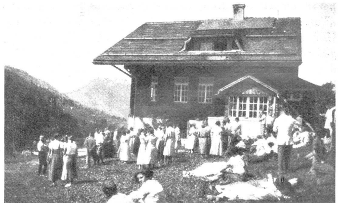
Nach dem Vortrag, die richtige Diskussion von Mund zu Mund, von Herz zu Herz

Sie spüren: die Heimat sind nicht Berg und Tal allein; es sind die Menschen, die sie beleben. Die Menschen aber treffen Sie vor allem in der Familie . Deshalb versteht es sich von selbst, daß wir in der Heimatwoche zuerst von Ehe und