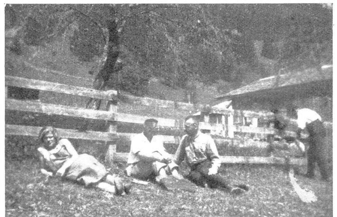
Ein ernstes Gespräch mit dem Direktor der Volksbibliothek über das Problem der heutigen Generationen

Und nun hören Sie, wie dort das Mädchen Haydns Kindersymphonie einführt: „Dr Josef Haydn isch einisch z'Märit g'gange. A vielne Stände hät me Gvätterzüg verchauft. D'Lüt, wo öppis hei welle chaufe, hei probiert, eb d'Trummete, t'Trummele, t'Guggere n-u t'Wasserpfyfli guet gange. Esisch e Mordslärme gsi. Aber der Haydn het nit öppe gchriegt, das tönigrüseli falsch. Er het glachet. Wo-n-er wieder diheime gsi isch, het er das Tutle und Tschädere no i de-n-Ohre gha. Was macht er? Er geit a Schrybtisch u schrybt es fröhlichs Musikstück grad für die Chinderinstrumentli. – Es isch schad, daß me-n-em Papa Haydn nid cha säge, wieviel