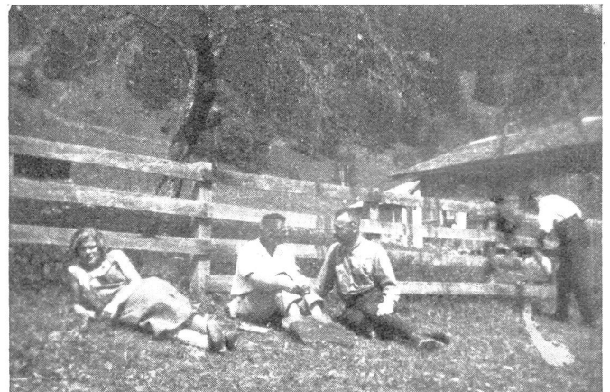
Ein ernstes Gespräch mit dem Direktor der Volksbibliothek über das Problem der heutigen Generationen

Und nun hören Sie, wie dort das Mädchen Haydns Kindersymphonie einführt: „Dr Josef Haydn isch einisch z'Märit g'gange. A vielne Stände hät me Gvätterzüg verchauft. D'Lüt, wo öppis hei welle chaufe, hei probiert, eb d'Trummete, t'Trummele, t'Guggere n-u t'Wasserpfyfli guet gange. Esisch e Mordslärme gsi. Aber der Haydn het nit öppe gchriegt, das tönigrüseli falsch. Er het glachet. Wo-n-er wieder diheime gsi isch, het er das Tutle und Tschädere no i de-n-Ohre gha. Was macht er? Er geit a Schrybtisch u schrybt es fröhlichs Musikstück grad für die Chinderinstrumentli. – Es isch schad, daß me-n-em Papa Haydn nid cha säge, wieviel