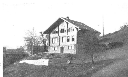
Abb. 4. Neues Schulhaus Says

Die Erzählung einer Lehrerin hat mich seltsam berührt. (Sie lebt in einer Gemeinde mit nicht 40 Einwohnern und unterrichtet eine Gesamtschule von sechs Schülern.) Wie sie den Kleinen vom Schneewittchen berichtet und zu der Stelle kommt, wo die Zwerge die Tote in den Sarg legen, wissen die Kinder nicht, was ein Sarg ist, weil so selten in der Gemeinde jemand stirbt. Wunderlich ferne Welt, wo so selten jemand stirbt! Was sind da Weihnachten, das Neujahrsfest, Karfreitag und Ostern für eindrucksvolle Stationen auf der Lebensfahrt! Oder das hübsche Schulschluss- und Frühlingsfest: „D' Letzenig“, ein alter Brauch im hochgelegenen Furna im Prätigau. Jedes Kind bringt am letzten Schultag Rahm und Löffel mit. Aus der Nachbarschaft des Schulhauses werden Kessel und Schüsseln herbeigeschafft. Aus dem Tale sind Weißbrötchen angekommen. Nun schwingen die ältesten Schulmädchen die Nidel. Nachdem die mit Zucker und fröhlichen Späßen versüßte „Luggmilch“ geschmaust ist, geht's auf die „Platta“, die untersten Furner Heimwesen, wo auf apert Stellen Maßliebchen ihre schlummerroten Augen öffnen und der Frühling aus Enzian- und Krokuskelchen lächelt. Da wird gesungen, gespielt, gescherzt und gelacht. Ein schlichtes Schulschlussfestchen.