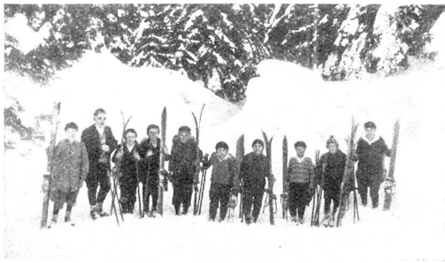
Abb. 3. Aufbruch zur Wildfütterung

wegs so gut, wie der Bauer meint. Die Löhnung ist ordentlich, aber nicht glänzend, sie deckt nur das halbe Jahr. Die übrige Zeit ist er Bauer oder sucht in Hotels oder Geschäften Verdienst. Sehr oft ist dieser Bauernbetrieb klein: ein paar Kühe und eine Zahl Bienenstöcke. Vor allem aber empfindet er den Mangel an Anregungsmöglichkeiten. Ist ein weitsichtiger Pfarrer, ein aufgeschlossener Arzt oder pensionierter Beamter im Dorf, dann gibt's manche Aussprache und Belehrung. Sind sie aber unnahbare Respektspersonen, dann ist der selten erscheinende Inspektor der einzige Berater und Freund. Dazu kommen einige Lehrerkonferenzen, die den Schulbetrieb unterbrechen. Aber man denke etwa an den Averser Lehrer. Er kann in 20 Jahren keine zwei Dutzend Konferenzen besuchen. Der Lehrer von Tenna muß unter Umständen vier Stunden bis zum Konferenzort zurücklegen, also vier Stunden hin und vier zurück. So ist der Bergschulmeister in großer Gefahr, einzurosten und den nötigen Schwung zu verlieren. Leider fehlt es an Stipendien, die ihm Reisen oder Ausbildungssemester ermöglichen würden. Ein Bauernkanton hat für dergleichen wenig Sinn und noch weniger Geld.