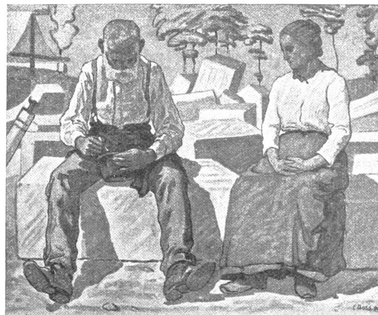
Eduard Boss: Steinhauers Mittagsmahl, Wolfsbergdruck

neben der andern. Sie helfen einander oder sie dämpfen einander. Das Blau der sonntäglich sauberen Bluse leuchtet aus der Wand heraus. Es wird blauer durch die Helligkeit der Wand. Das Rot der Handorgel sticht aus dem Blau der Bluse heraus und belebt das Gelbe des Blasbalges. Das Silberhaar des Alten bekommt durch den farbigen Hintergrund ein frohes Leuchten.