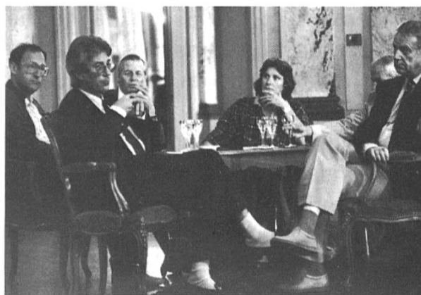
... sowie Gäste und Presseleute wissen...