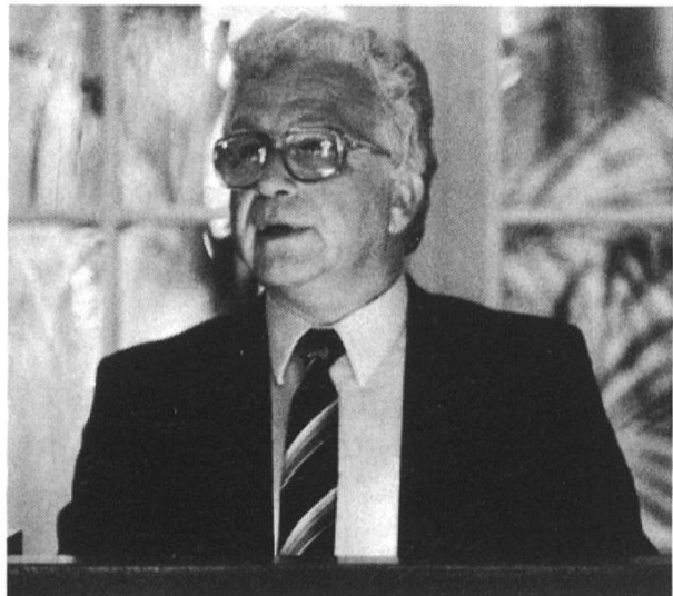
Le créateur de la Fondation Franz Michel...

Nous sommes à la veille d'une nouvelle étape importante pour l'avenir de l'école privée. Tous ceux qui participent à cette entreprise sont aujourd'hui nos invités, que ce soit à titre d'initiateurs, de promoteurs, d'exécutants ou de propagateurs auprès du public des idées qui nous tiennent à cœur.