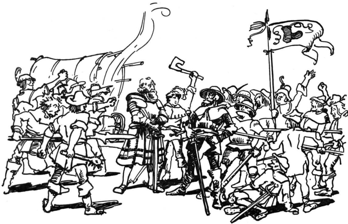
Goetz I. unter den aufständischen Bauern.

Dichter selbst bestätigt die Aussage in einem Gespräch mit Eckermann, wo er der vielen Mühe gedenkt, die er sich nachmals mit seinem Goetz gegeben, um ihn bühnengerechter zu gestalten. «Allein es ist ein eigenes Ding», sagt er, «ein Stück, das nicht ursprünglich und mit Geschick des Dichters für die Bühne geschrieben ist, geht auch nicht hinauf, wie man auch damit verfährt, es wird immer etwas Ungehöriges und Widerstrebendes behalten».