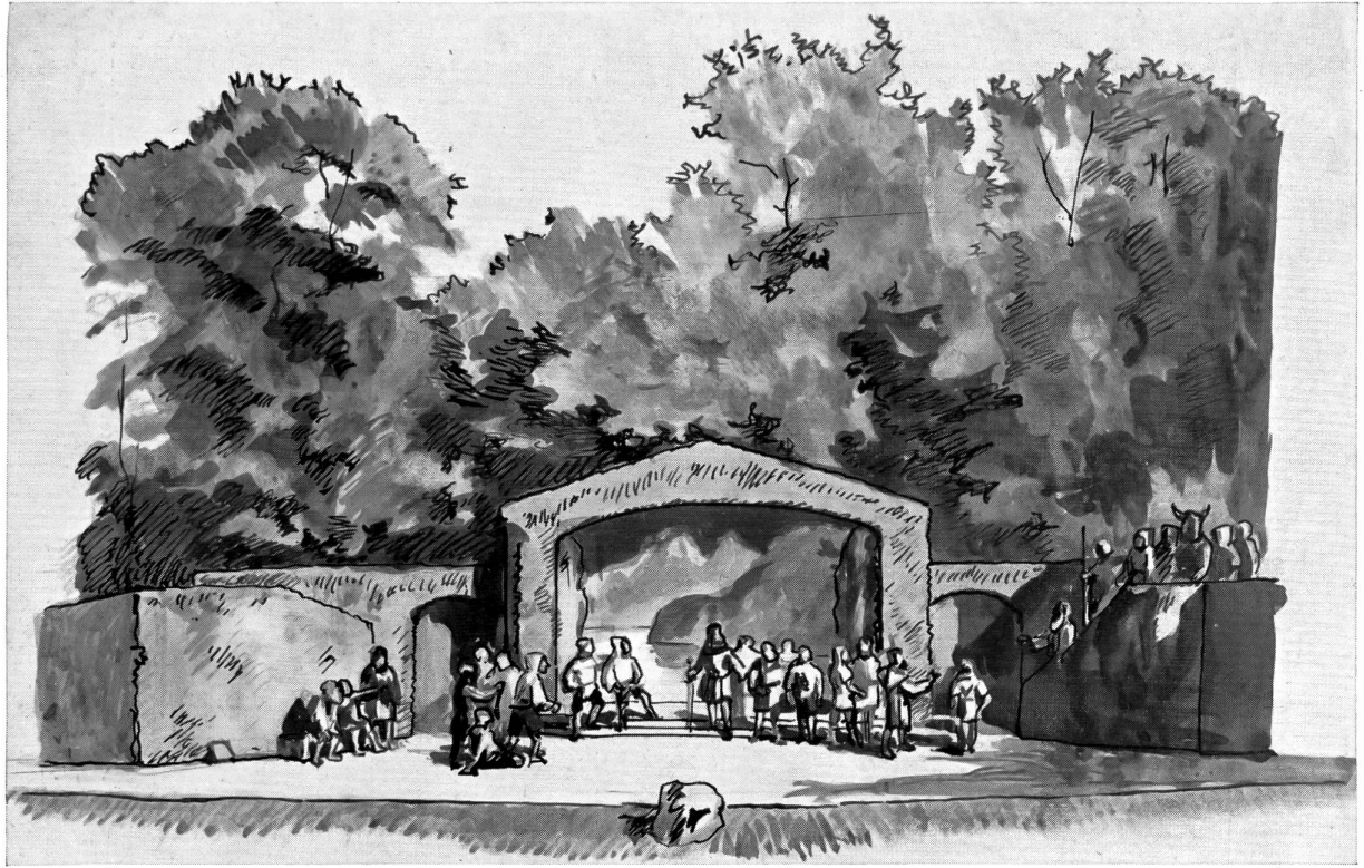
«Tell» auf dem Fäsenstaub in Schaffhausen. 1905.