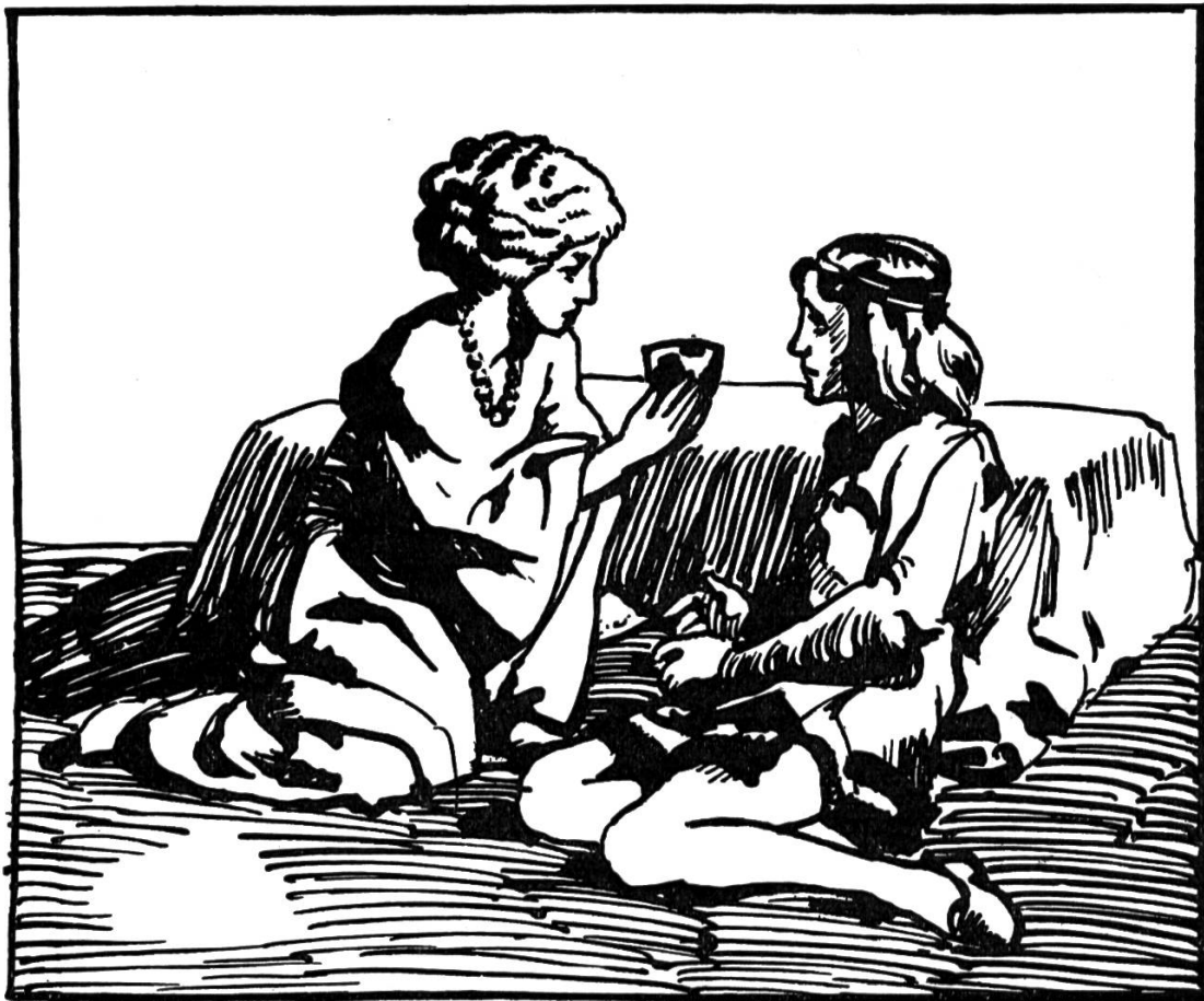
Ostwind reicht Erwin die Schale.