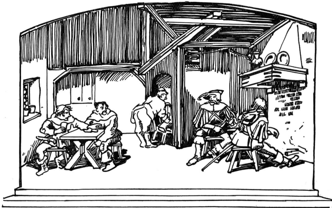
Goetz von Berlichingen. Szene in der Schenke.

Berlin. Ein trefflicher und begeisterter Anhänger des Planes erwuchs mir dann im Frühling in Otto von Greyerz, der damals als Lehrer im Landeserziehungsheim Glarisegg amfete. Nachdem wir die wenigen Kürzungen und kleinen Verschiebungen sorgfältig miteinander besprochen hatten, machte er sich anheischig, für die vorgesehene Ausgabe eines Textbüchleins eine warm sich einsetzende Einleitung zu schreiben.