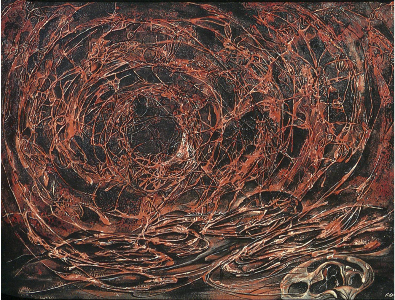
3 Spirale rot