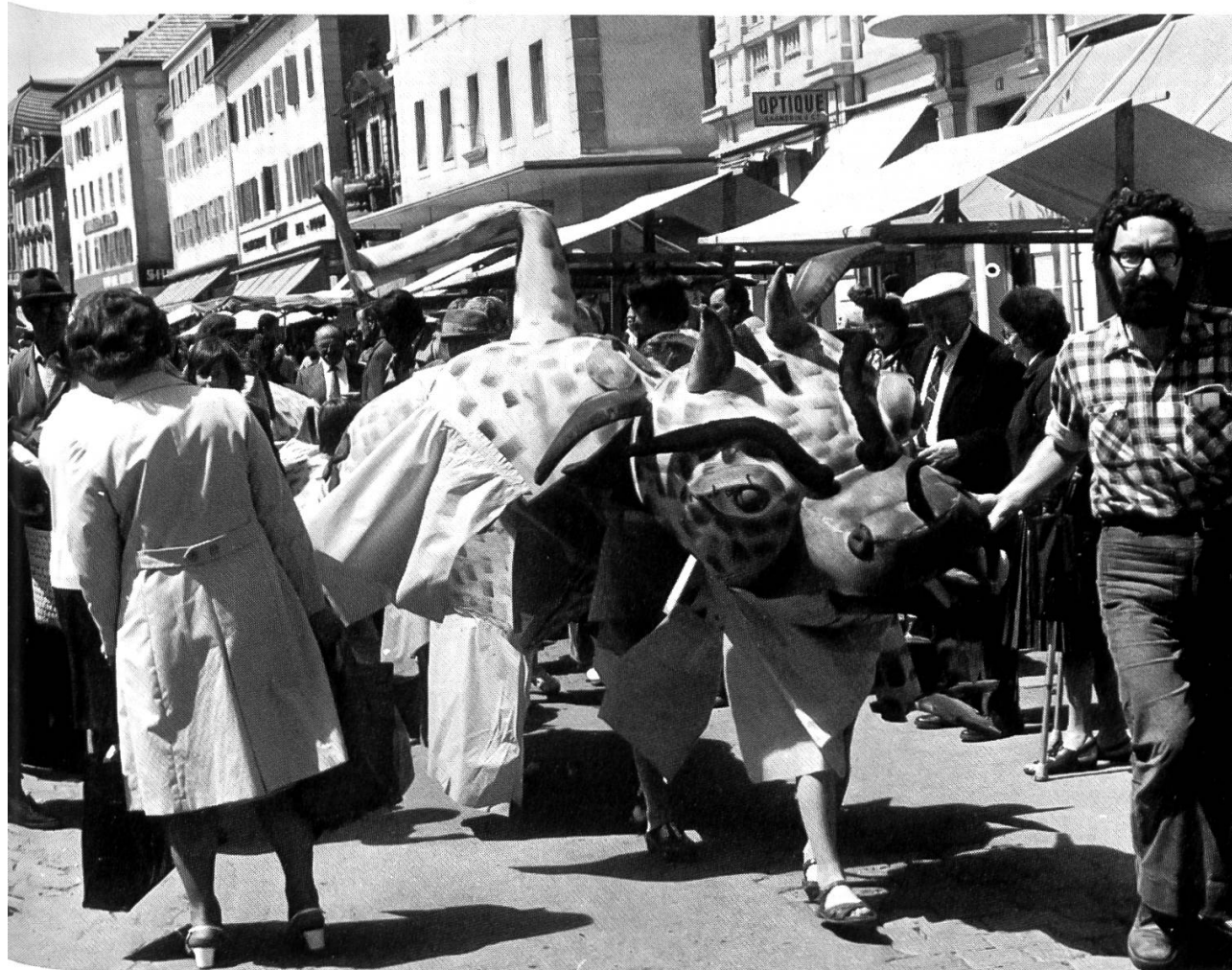
Théâtre Populaire Romand: Animation de rue. Biennale, 1974

1974 enfin, la IV e Biennale montre trois exemples de notre ani-