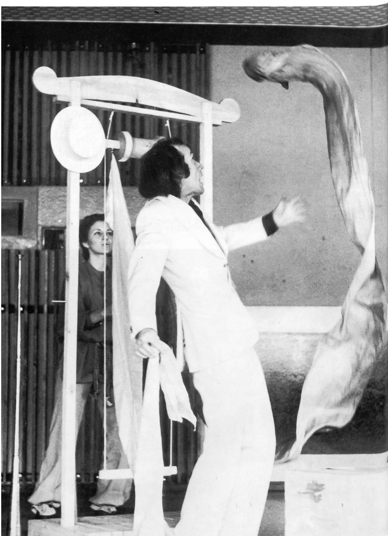
Pascal Dayer: «Dragon jaune et Dragon bleu», 1978