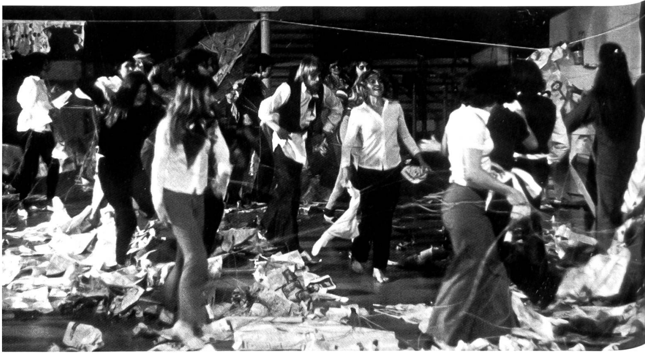
Théâtre Populaire Romand: Animation Stage d'enseignants jurassiens, 1975

l'école et avec les institutions, des structures des troupes, etc. Un article de Jean Gabriel Carasso dans «Travail théâtral» (N° 26) résume ces débats qui furent un véritable dialogue entre une région active et les spécialistes qu'elle souhaitait interroger. A cela s'ajoutent 40 stagiaires, la plupart enseignants ou animateurs, dans quatre stages d'une semaine.