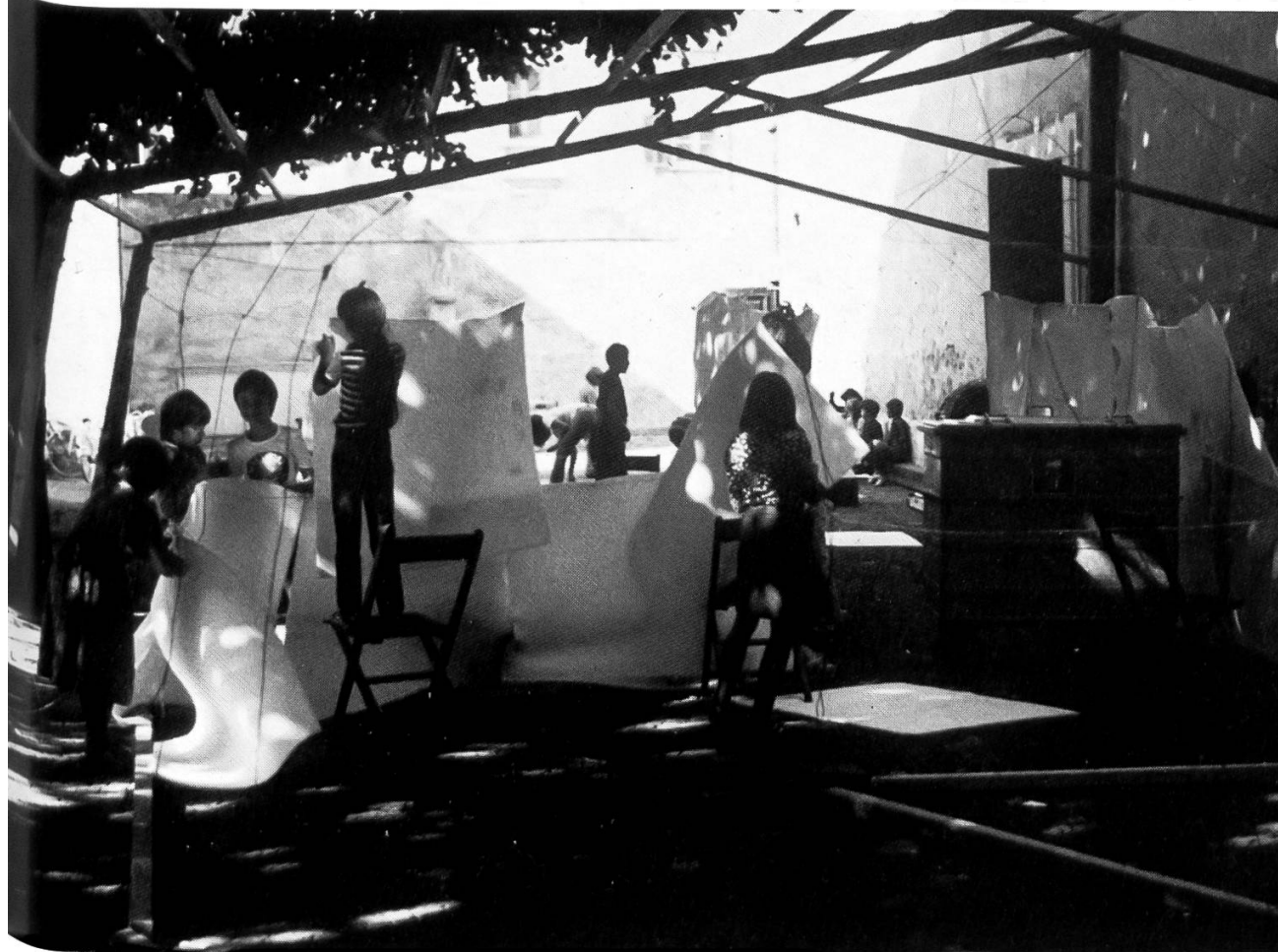
Centre Culturel Régional Delémont: Animation Théâtre de Rue, 1978

Le plupart des 16 groupes et solistes invités restèrent à Bremgarten pendant toute la durée des Rencontres et purent échanger