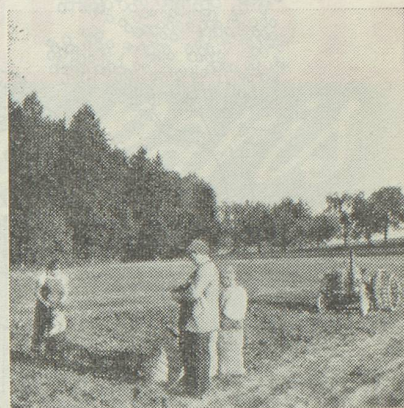
Les pensionnaires du «Home» suivent avec grand intérêt les travaux d'automne à la ferme du «Home»