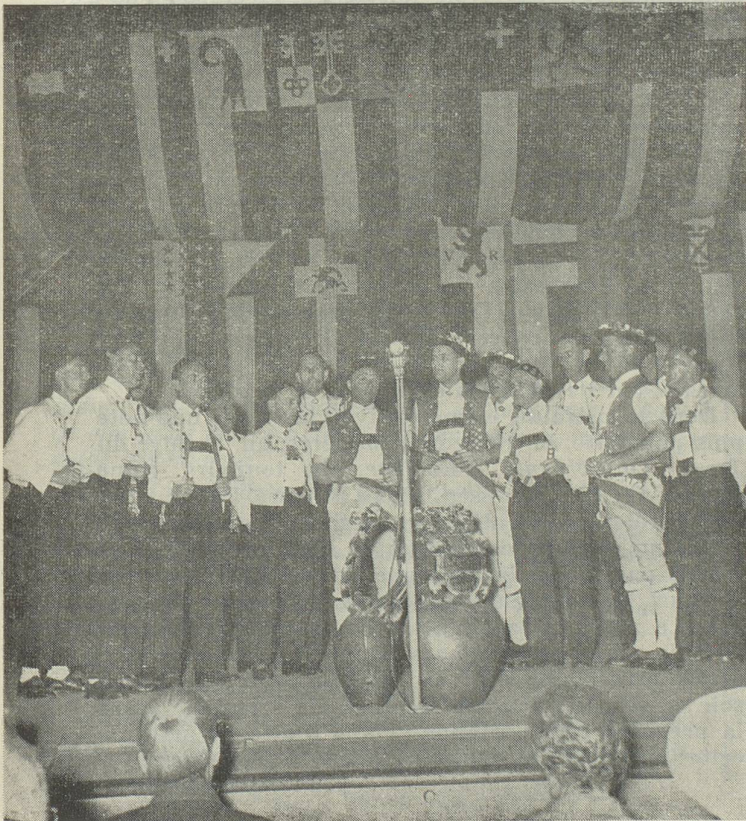
Et voici les armaillis des montagnes d'Appenzell