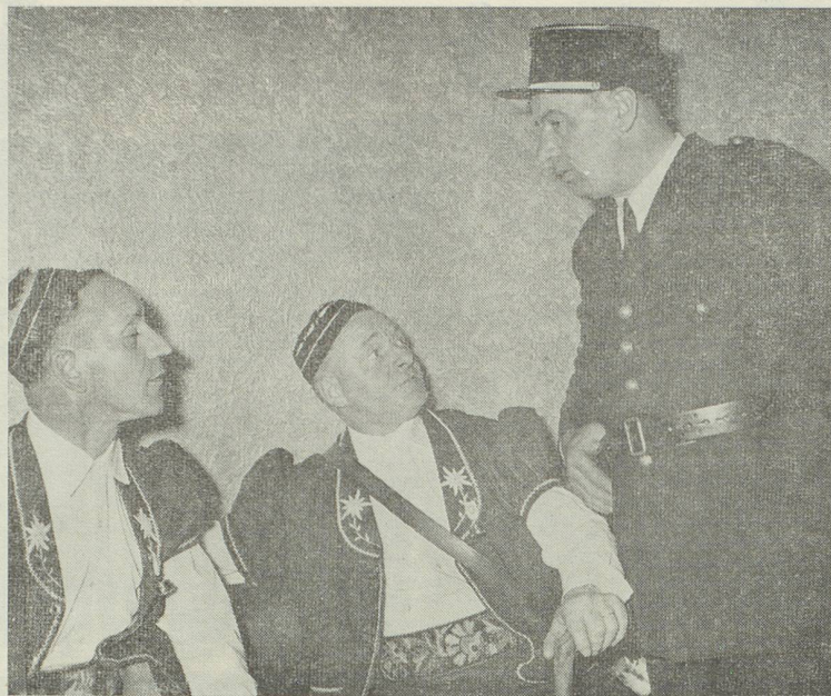
Deux armaillis gruériens écoutent, intéressés, les conseils d'un agent parisien.