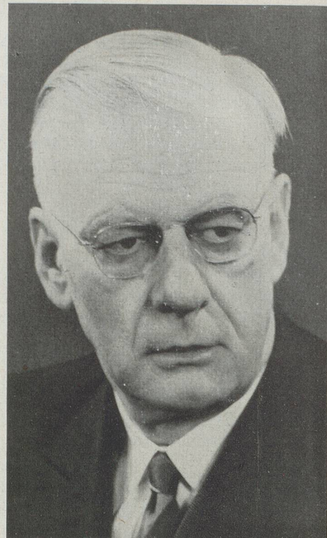
CONSEILLER FÉDÉRAL MARKUS FELDMANN

Né le 7 février 1896, originaire de Bütschwil (St-Gall). Études de droit de 1915 à 1920 à Bâle, Genève, Berne et Rome, docteur en droit en 1920. Pratique le barreau dès 1920 à St-Gall. Membre du Conseil de l'École des hautes-études commerciales de St-Gall. Président de la Commission fédérale des banques de 1951 à 1954. Député au Grand Conseil du canton de St-Gall de 1936 à 1954. Député au Conseil national de 1937 à 1954 (président pour 1952/53). Au militaire : Colonel de l'Etat-Major général. Le 16 décembre 1954, l'Assemblée fédérale l'élit Conseiller fédéral en remplacement du Conseiller fédéral Rubattel, démissionnaire.