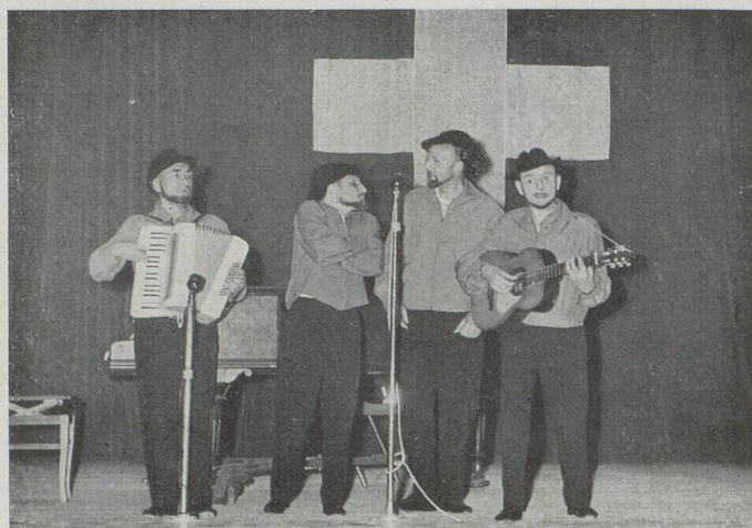
Les fameux « Quatre Barbus »

Le 7 avril dernier, fidèles au rendez-vous annuel des Chanteurs et Gymnastes, de nombreux compatriotes occupaient les confortables fauteuils de la grande salle de la Cité Universitaire.