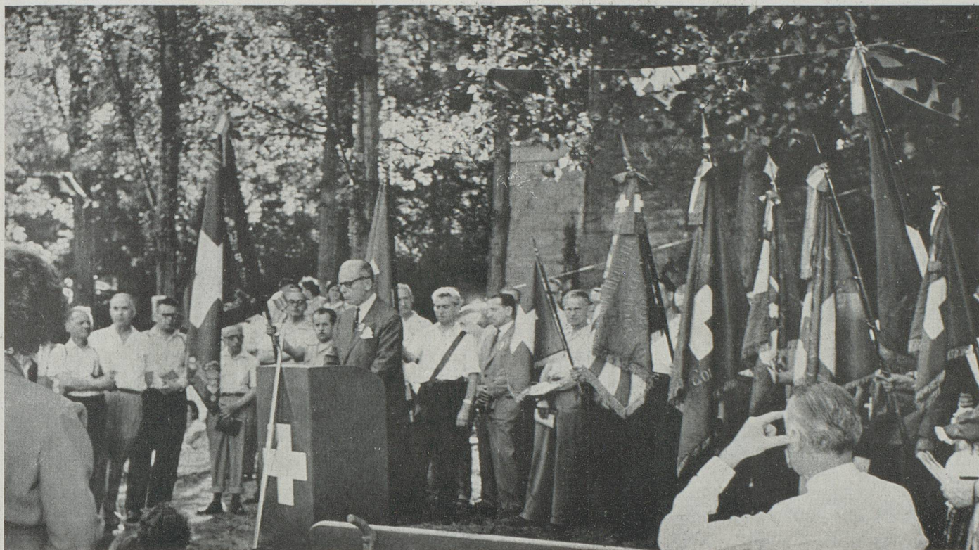
S.E. l'Ambassadeur de Suisse prononçant son discours

— Mes premières paroles seront des paroles de gratitude et de reconnaissance.