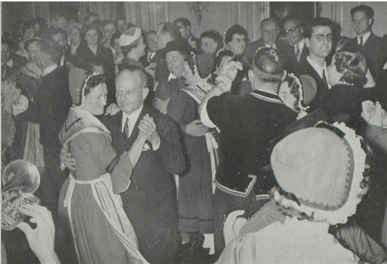
Sauterie amicale, ouverte par S.E. l'Ambassadeur et une gracieuse Jurassienne