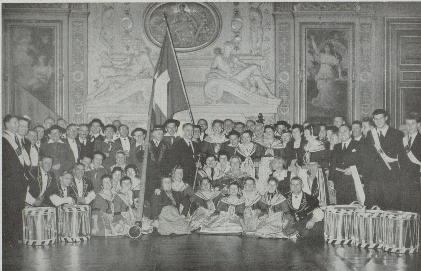
Fifres, tambours, chanteurs, musiciens posent pour la photo-souvenir dans les salons de l'Hôtel-de-Ville