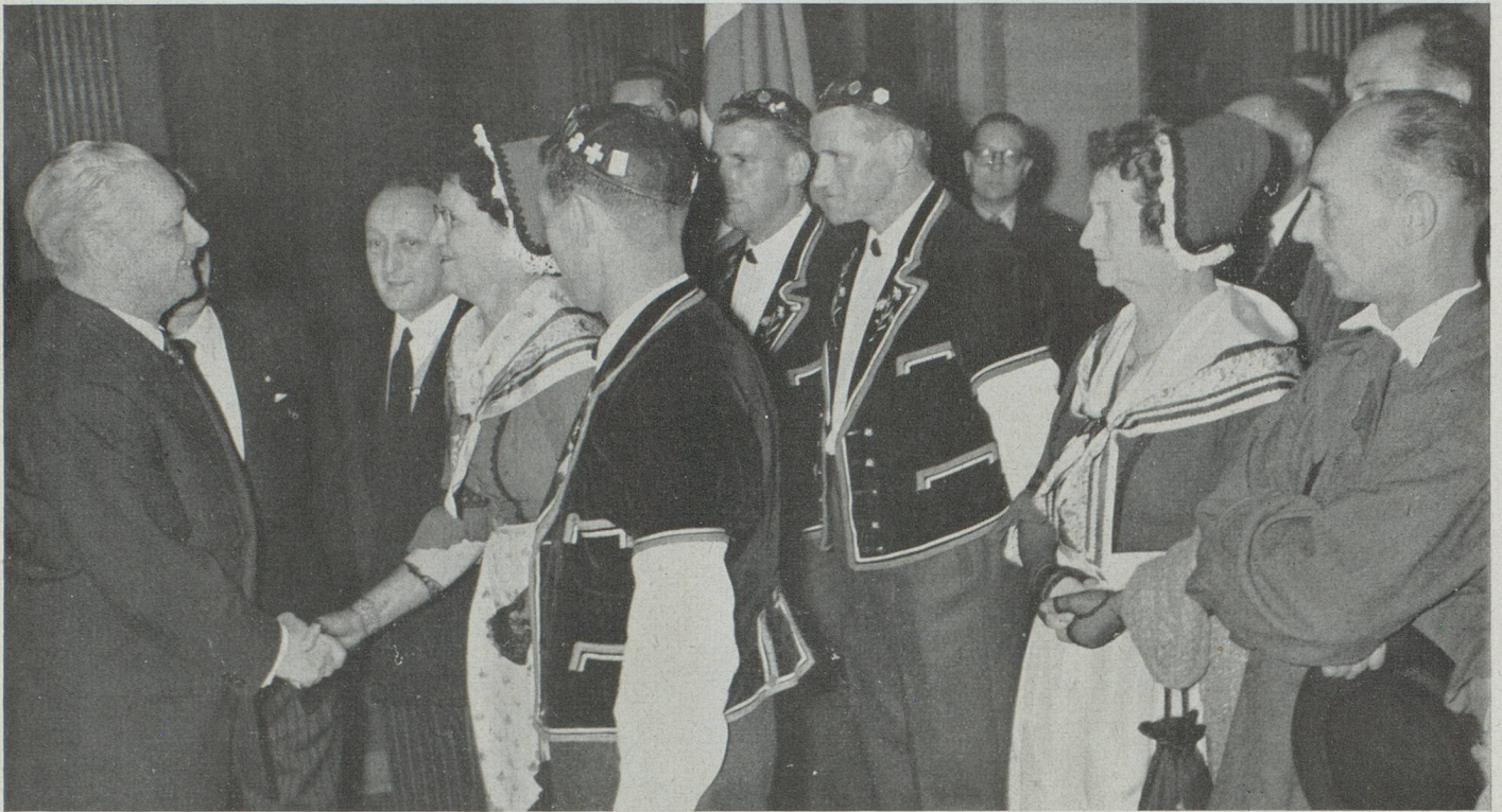
Après le spectacle, un vin d'honneur fut servi aux officiels et l'Ambassadeur eut à cœur de féliciter les principaux participants