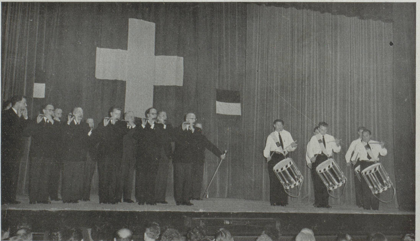
Fifres et tambours de Bâle