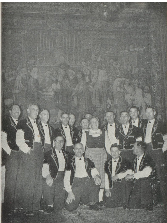
Devant la célèbre tapisserie des Gobelins qui orne l'un des salons de l'Ambassade, photo-souvenir du Jodler-Club de Fullinsdorf.