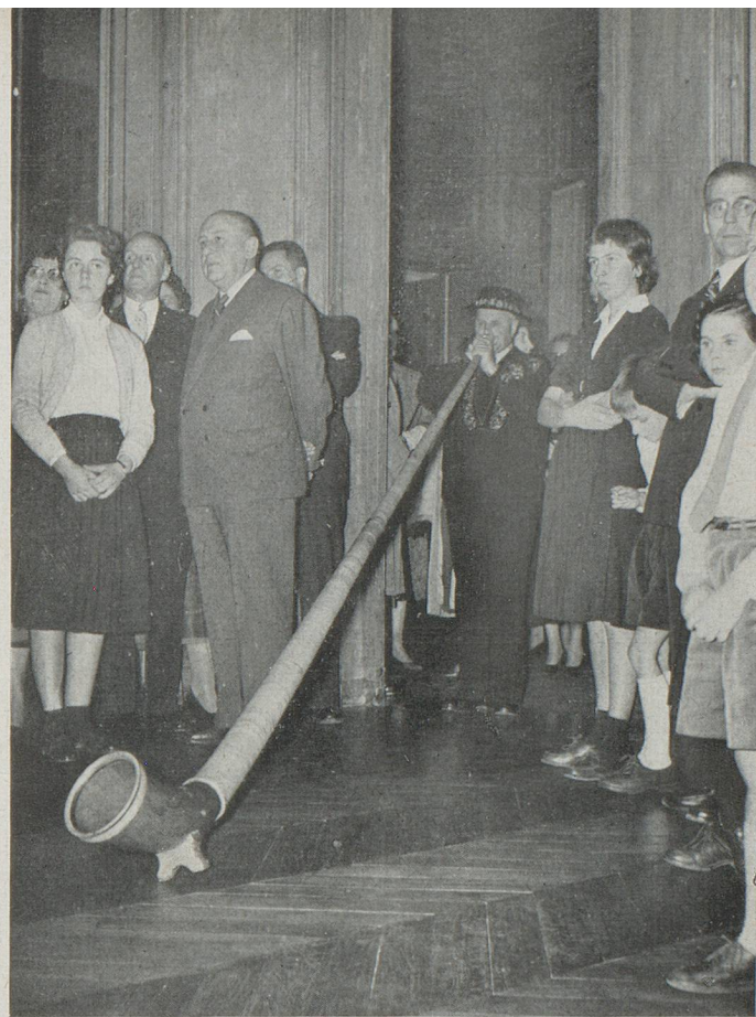
Un spectacle inaccoutumé pour une ambassade. Le cor des Alpes se fait entendre, lors de la réception cordiale qui fut donnée pour le Centenaire de l'Harmonie suisse de Paris.