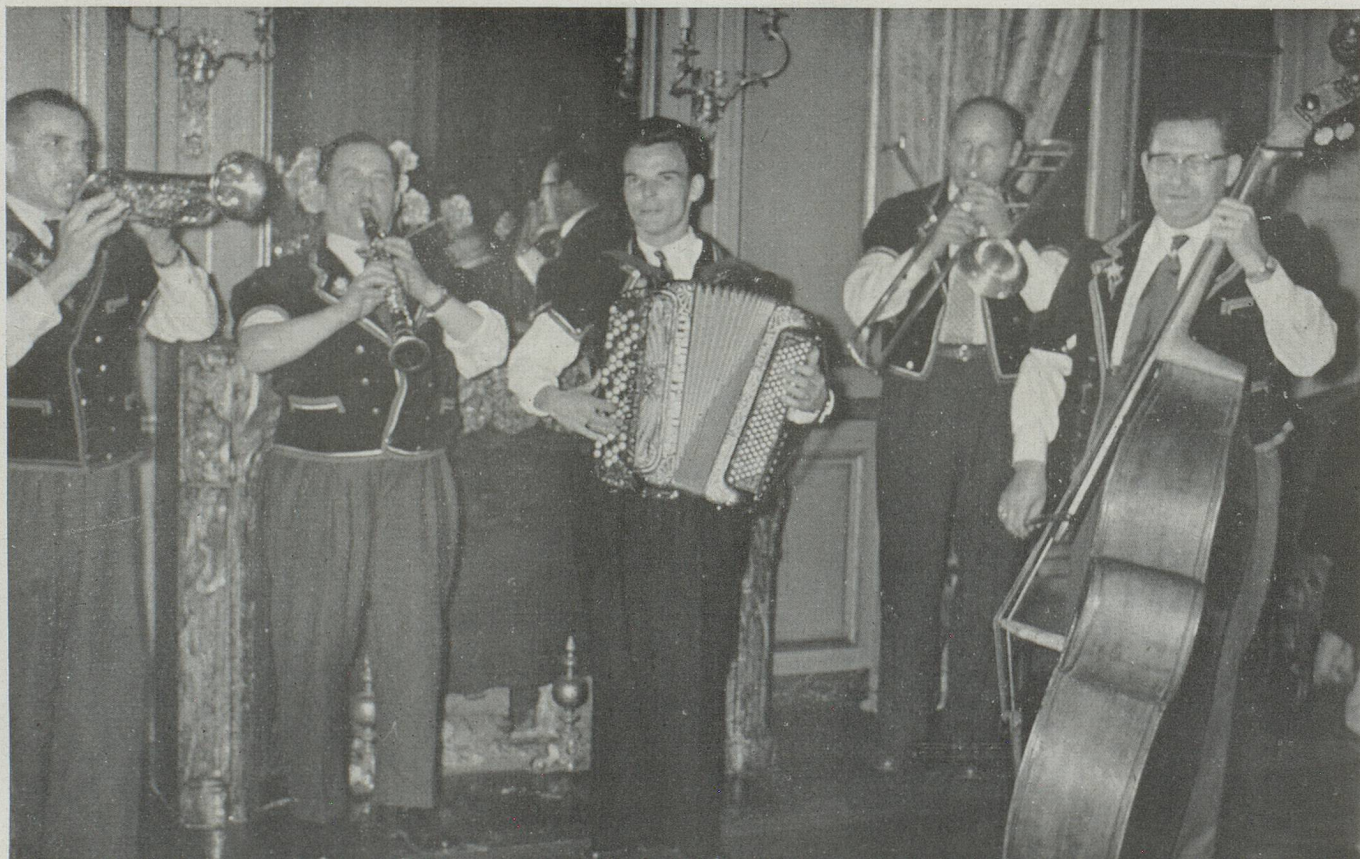
La Laendlerkappelle « Heimelig » de Bâle