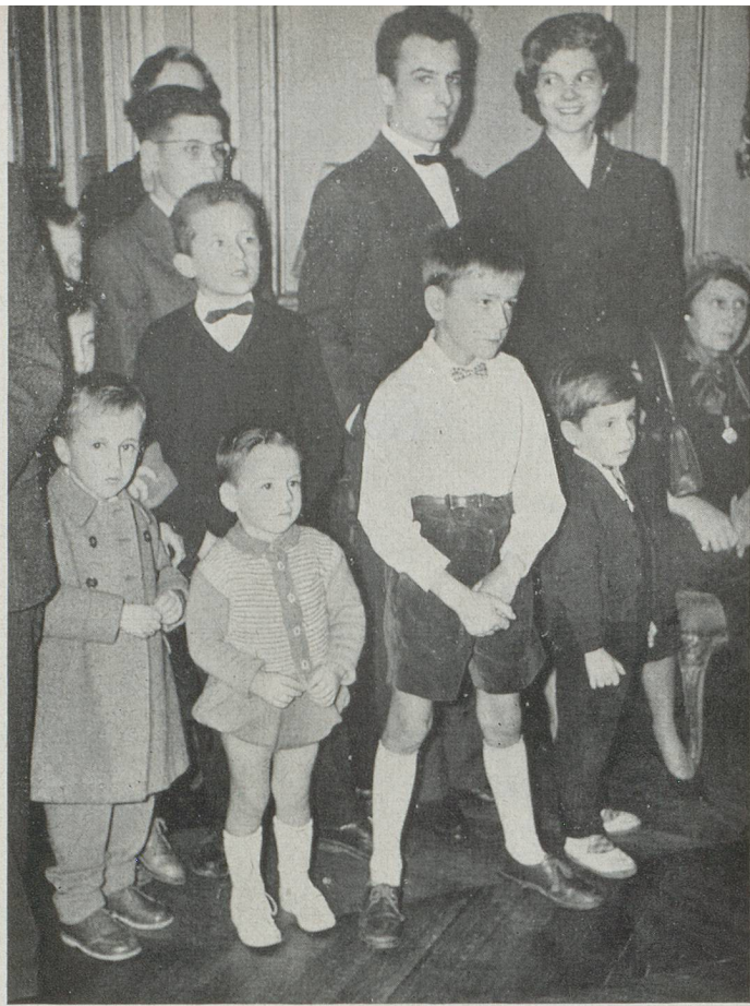
Les enfants étaient du nombre et accentuèrent par leur présence le caractère familial de la réception.