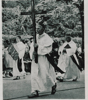
Catholique depuis toujours, Fribourg fut aussi l'émanation des saints hommes en qui se retrouvoient à la fois les vertus les plus chrétiennes et l'énergie des pionniers : voici les Pères d'Hauterive.