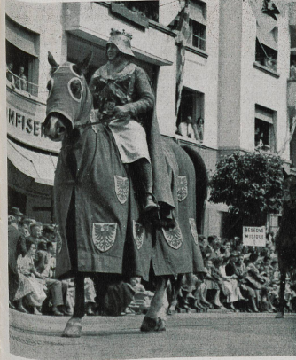
Berthold IV de Zähringen, premier seigneur attiré de ces lieux, fonda Fribourg en 1157.