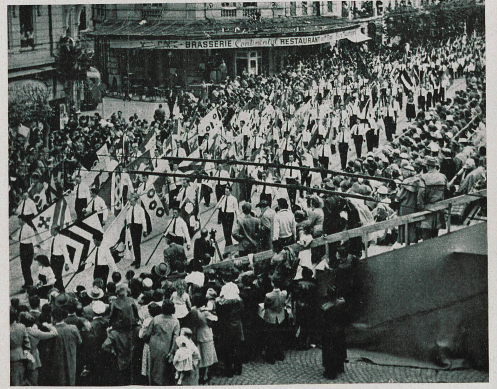
L'impesant défilé des drapeaux des 284 communes fribourgeoises terminait le cortège

cément fragmentaire, qui vous incitera peut-être à vous replonger de temps à autre dans vos livres d'histoire. Le cortège avait été précédé, le matin même, d'un « acte commémoratif » solennel, qui se déroula en présence des plus hautes autorités du pays. Il a été complété, sur différents plans, par des expositions historiques, artistiques, des fêtes et bals populaires, et une quinzaine gastronomique. Le tout s'est échelonné sur près de trois semaines — c'est dire que le bon vieux pays de Fribourg a bien fait les choses.