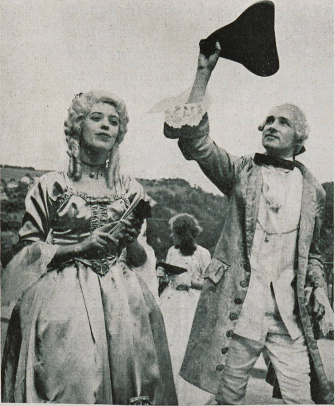
Dans les siècles passés, l'aristocratie fribourgeoise joua un rôle important, non seulement dans la vie de la cité, mais dans celle du pays. Portant perruques, tricorne et belles robes du temps passé, elle figurait aussi dans le merveilleux cortège.