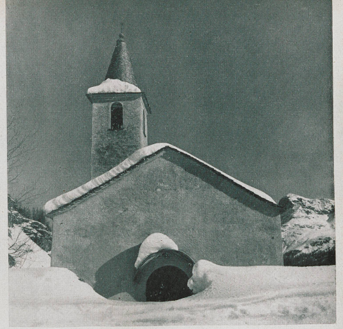
L'Eglise de Sils Maria