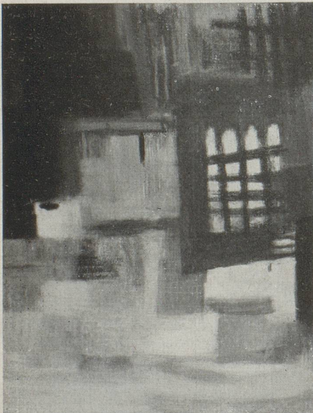
MARLY SCHUPBACH : Village abandonné

Le château, jusque dans ses corridors et dépendances, était plein de portraits de nobles personnes qui y avaient vécu, ainsi que des amis ou amies de ceux-ci. Un jour qu'il faisait particulièrement clair, je remarquai que les visages de tous ces personnages, habillés à la mode de l'Ancien Régime, paraissaient avoir été peints après coup, tranchaient avec le reste du portrait. Mme de Mandrot, notre hôtesse, fut à même de me donner l'explication de cette curieuse dissemblance : ces tableaux avaient été peints par des artistes ambulants, qui allaient aux beaux jours offrir leurs services de château en château. Ils promenaient avec eux des toiles sur lesquelles ils avaient déjà exécuté, durant les jours d'hiver, des corps fort bien vêtus, mais sans visage, d'hommes, femmes ou enfants de corpulences