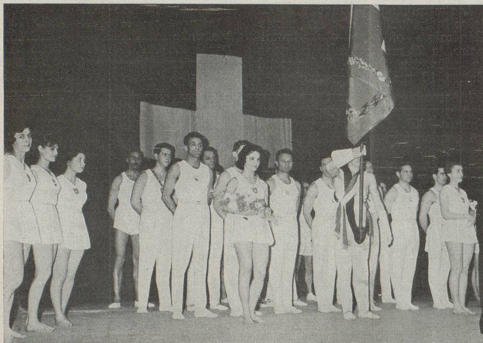
Le salut au drapeau des gymnastes

La magnifique Salle des Fêtes de la Cité universitaire avait mis, cette année encore, son cadre ravissant au service de la rencontre de près d'un millier de compatriotes venus de tous les coins de Paris et de sa banlieue.