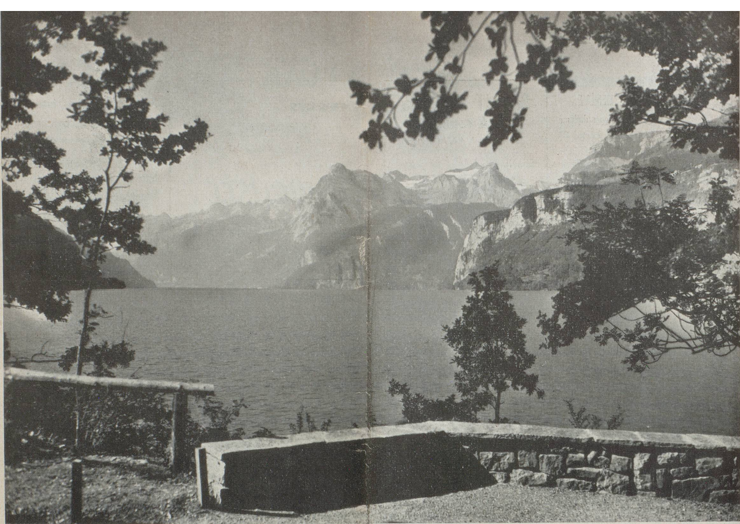
Axenquai à Brunnen au lac des Quatre-Cantons