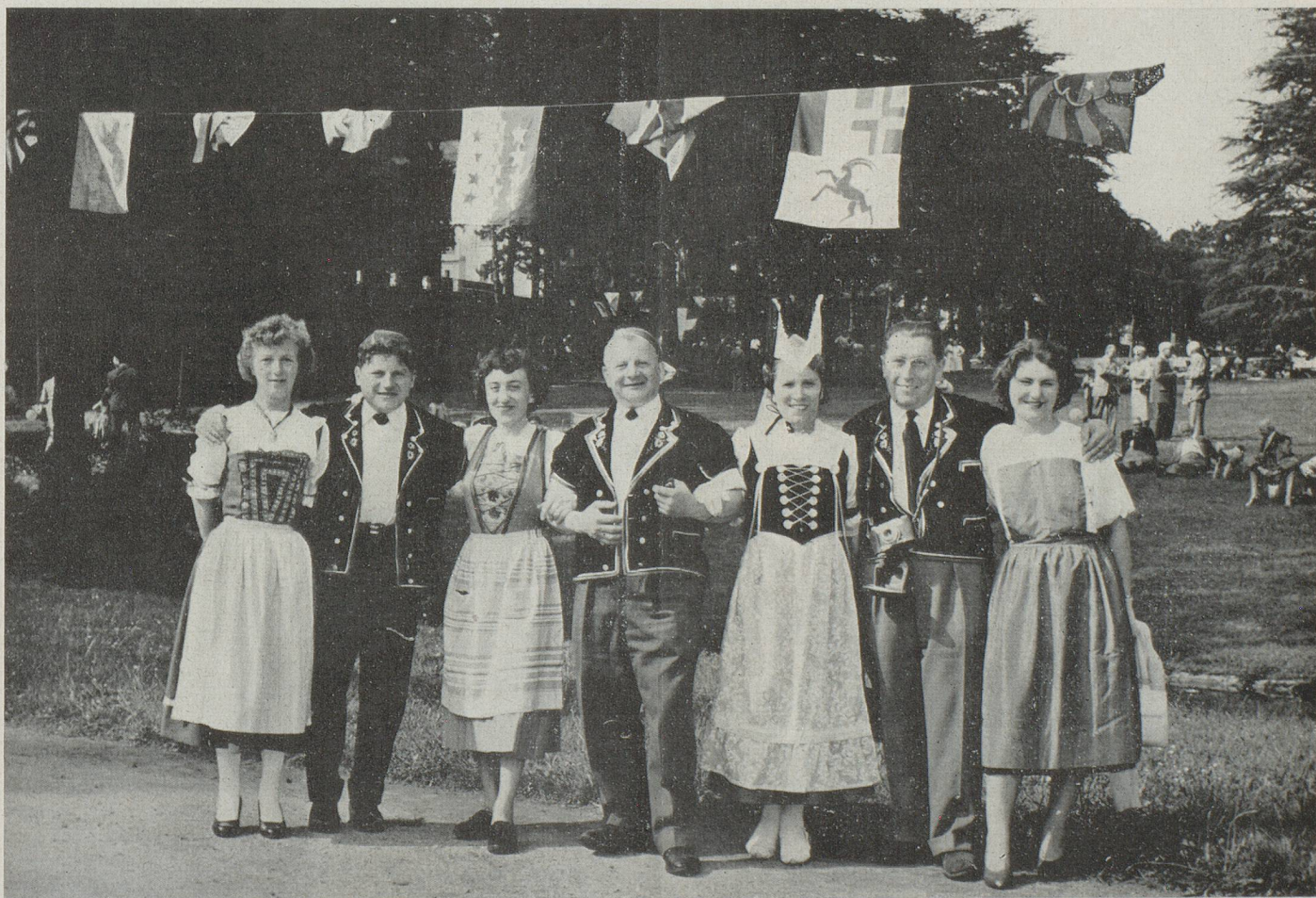
Certains de nos compatriotes avaient revêtu le beau costume de leurs cantons