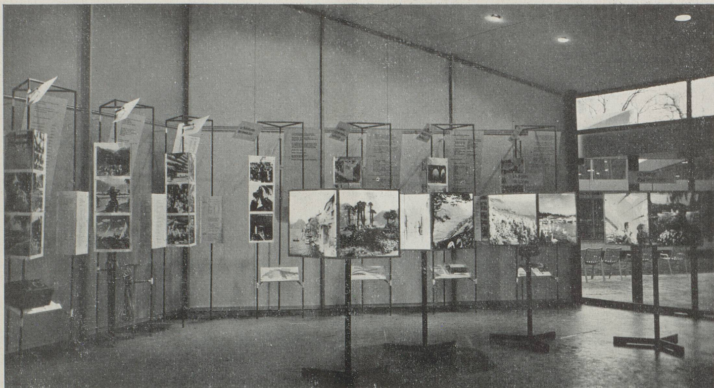
L'« inventaire touristique » de la Suisse est présenté de manière attrayante. Des colonnes hexagonales tournent lentement sur elles-mêmes, faisant valoir les beautés des dix régions touristiques de la Suisse : cinq surfaces de chacune de ces dix constructions éclairées sont ornées de diapositives en couleurs ; la sixième s'ouvre sur une petite vitrine