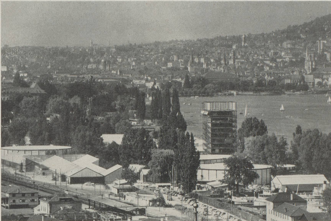
La SAFFA 1958. Vue générale avec le lac et la ville de Zurich