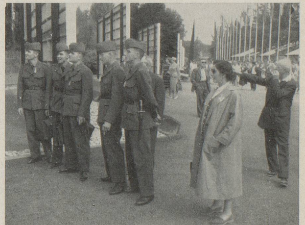
Quelques jeunes recrues, venues de l'étranger pour faire leur service au pays (photo en haut), et nos hôtes du « Home » (photo en bas) visitant la SAFFA 1958 lors de la Journée des Suisses à l'étranger à Baden - Zurich

Les cours, excursions, etc... n'ont lieu qu'en cas de participation suffisante; pour le reste, se référer aux conditions d'inscription figurant sur notre prospectus.