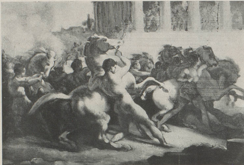
GERICAULT - La course de chevaux libres. Coll. H. E. Buhrlé, Zurich

Rien n'est plus facile que d'imaginer un thème d'exposition, mais rien n'est plus hasardeux que de le réaliser. Il y a une résistance des chefs-d'œuvre, une sorte d'inertie, dont il faut pouvoir se rendre maître. La rêverie a des pouvoirs que l'entreprise ne saurait jamais égaler.