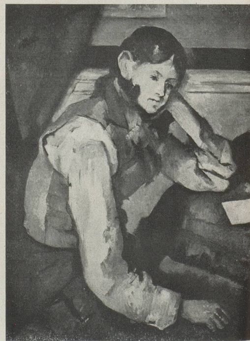
CEZANNE - Le garçon au gilet rouge Coll. Buhrlé, Zurich

André CHAMSON, de l'Académie Française, Conservateur en Chef du Petit Palais.