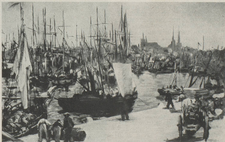
MANET - Le port de Bordeaux. Coll. Bührle, Zurich

J'ai le devoir agréable de remercier ici nos amis français, qui accueillent et présentent cette exposition. C'est un privilège pour nous d'avoir pu confier ces trésors de l'art français aux soins du musée du Petit Palais et de son conservateur en chef, M. André Chamson, de l'Académie française. Il ne nous a pas seulement offert le cadre digne de ces tableaux ; dès le premier entretien, où nous avons conçu l'idée de cette exposition, il a facilité de toutes les manières sa réalisation. J'exprime également notre vive gratitude à la Ville de Paris, qui a bien voulu ouvrir à ces chefs-d'œuvre les portes du musée du Petit Palais, et