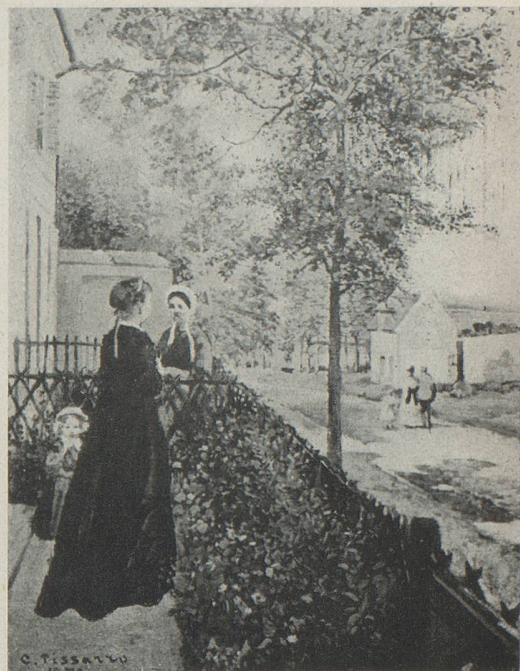
PISSARRO - La route de Versailles à Louveciennes Coll. Bührle, Zurich

aux autorités, tant françaises que suisses, qui nous ont conseillés et aidés.