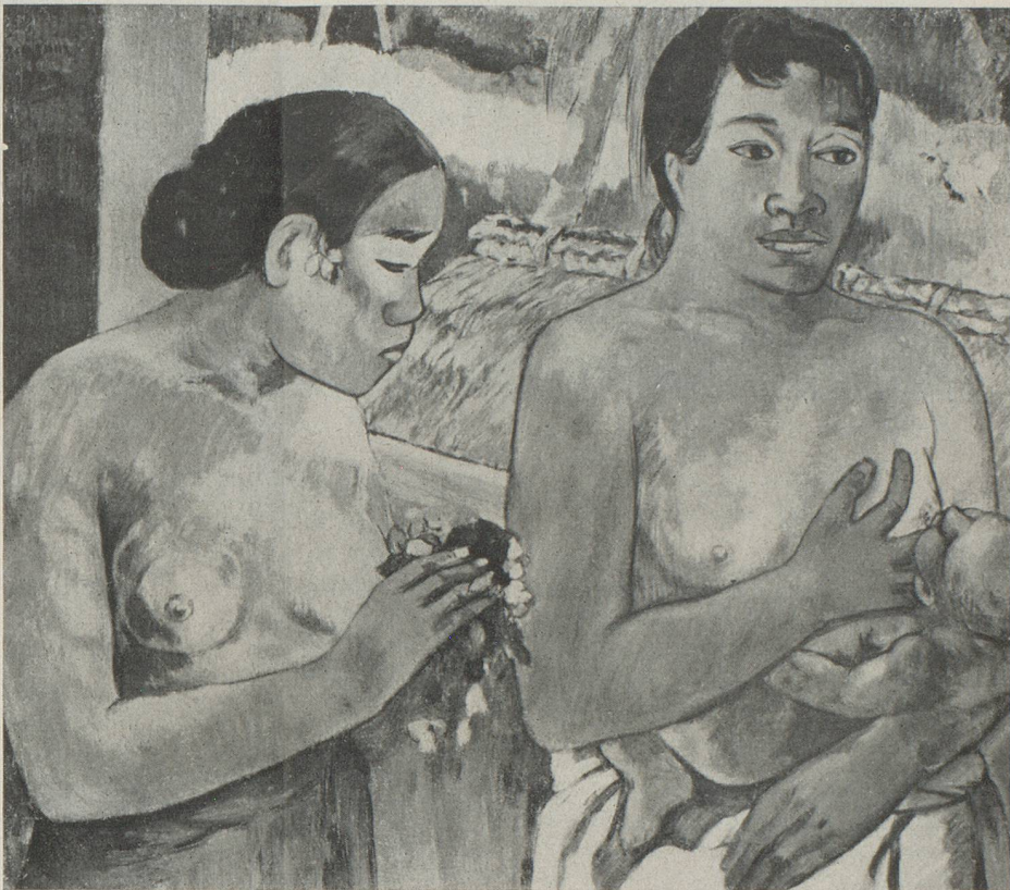
GAUGUIN - L'offrande. Coll. Burhle, Zurich

Ajoutons que la plupart des amateurs suisses, se sentant responsables