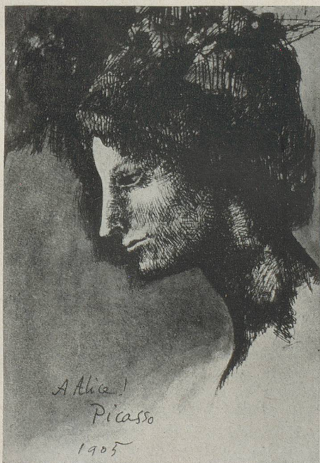
PICASSO - Alicia. Coll. particulière