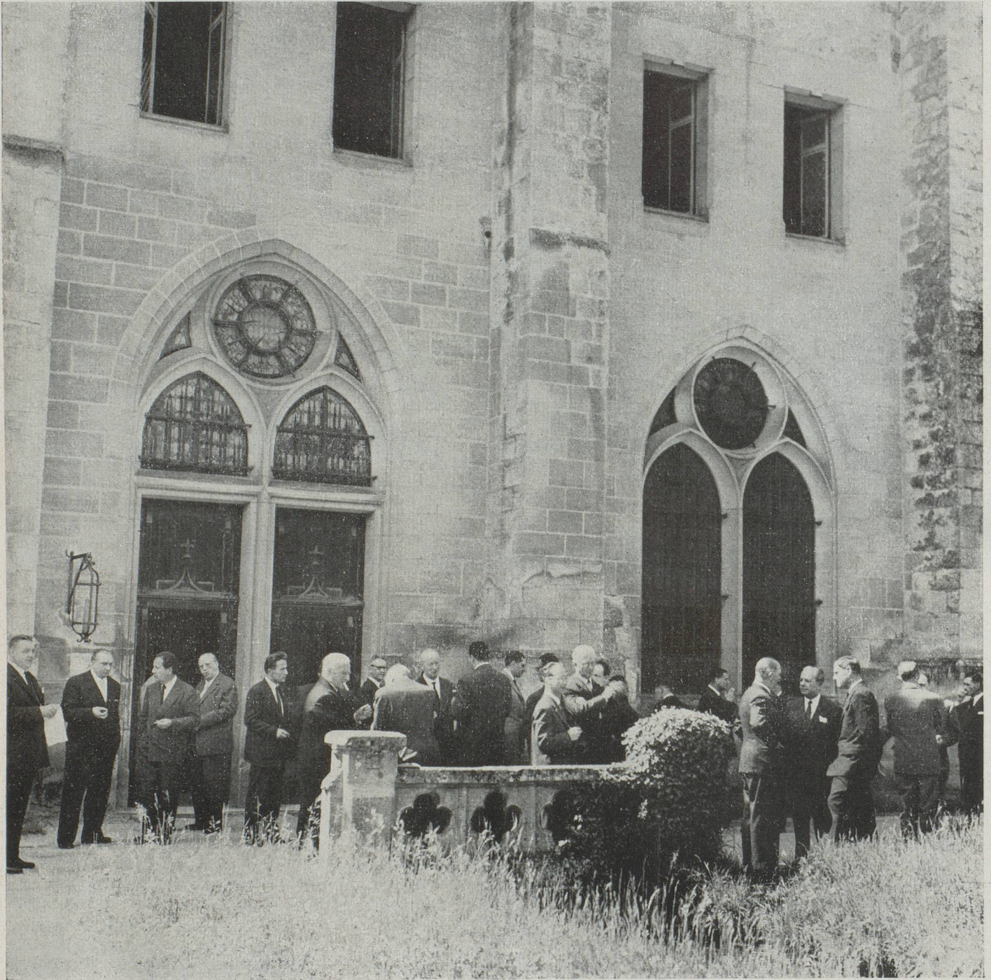
Quelques instants de détente après la réunion du matin, dans le parc de cette admirable abbaye de Royaumont