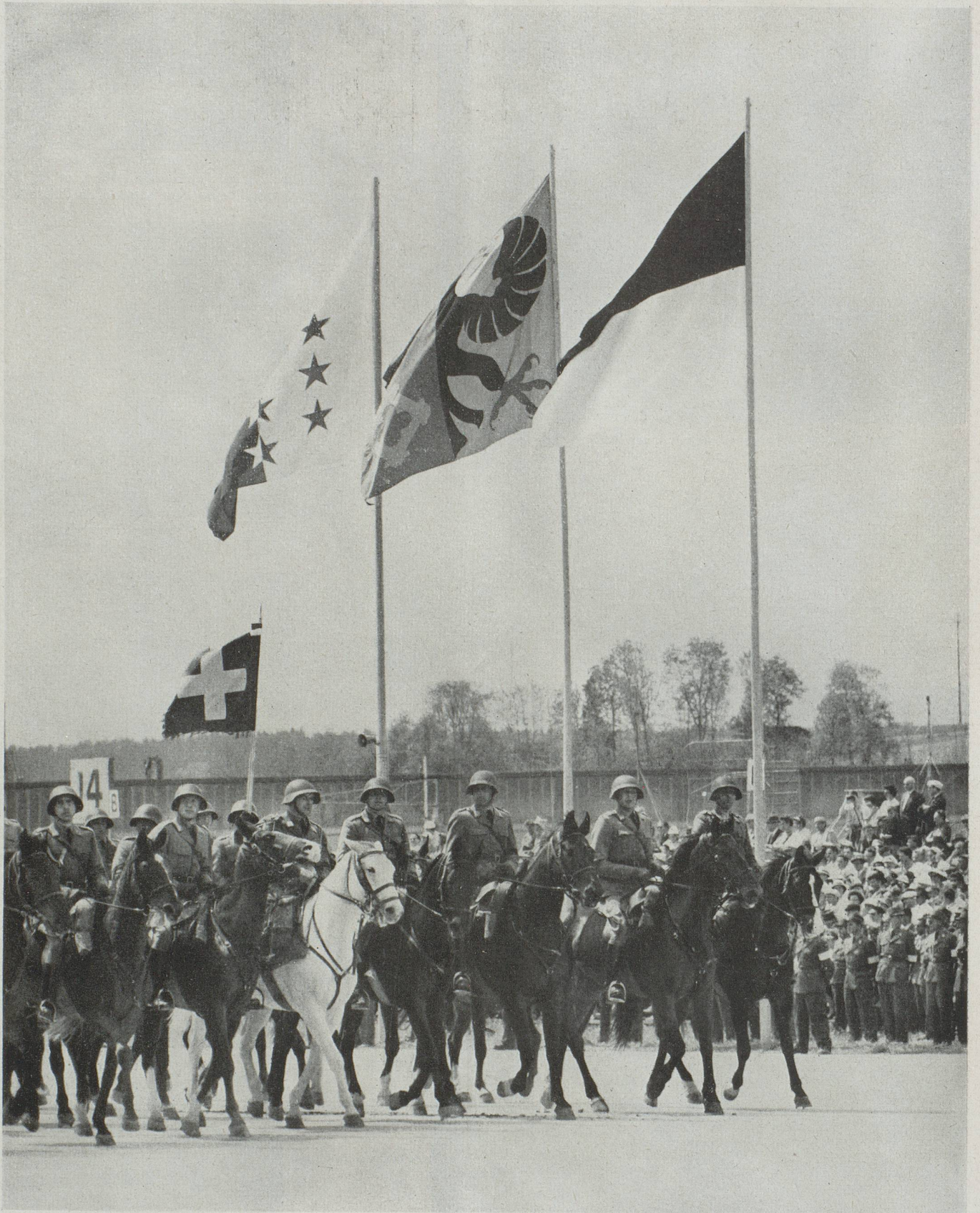
La troupe la plus applaudie : la cavalerie, comme toujours