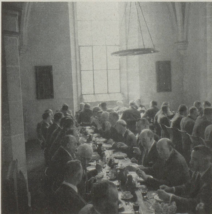
Un déjeuner amical réunit tous les délégués dans le réfectoire de l'abbaye