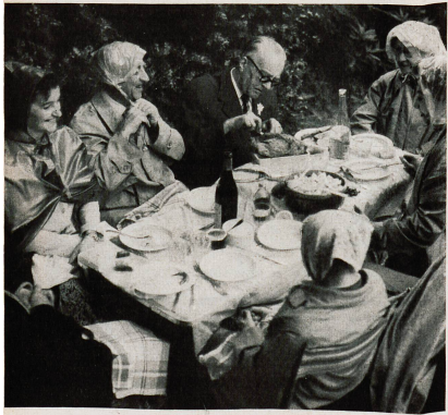
Un déjeuner non pas sur l'herbe mais sous la pluie