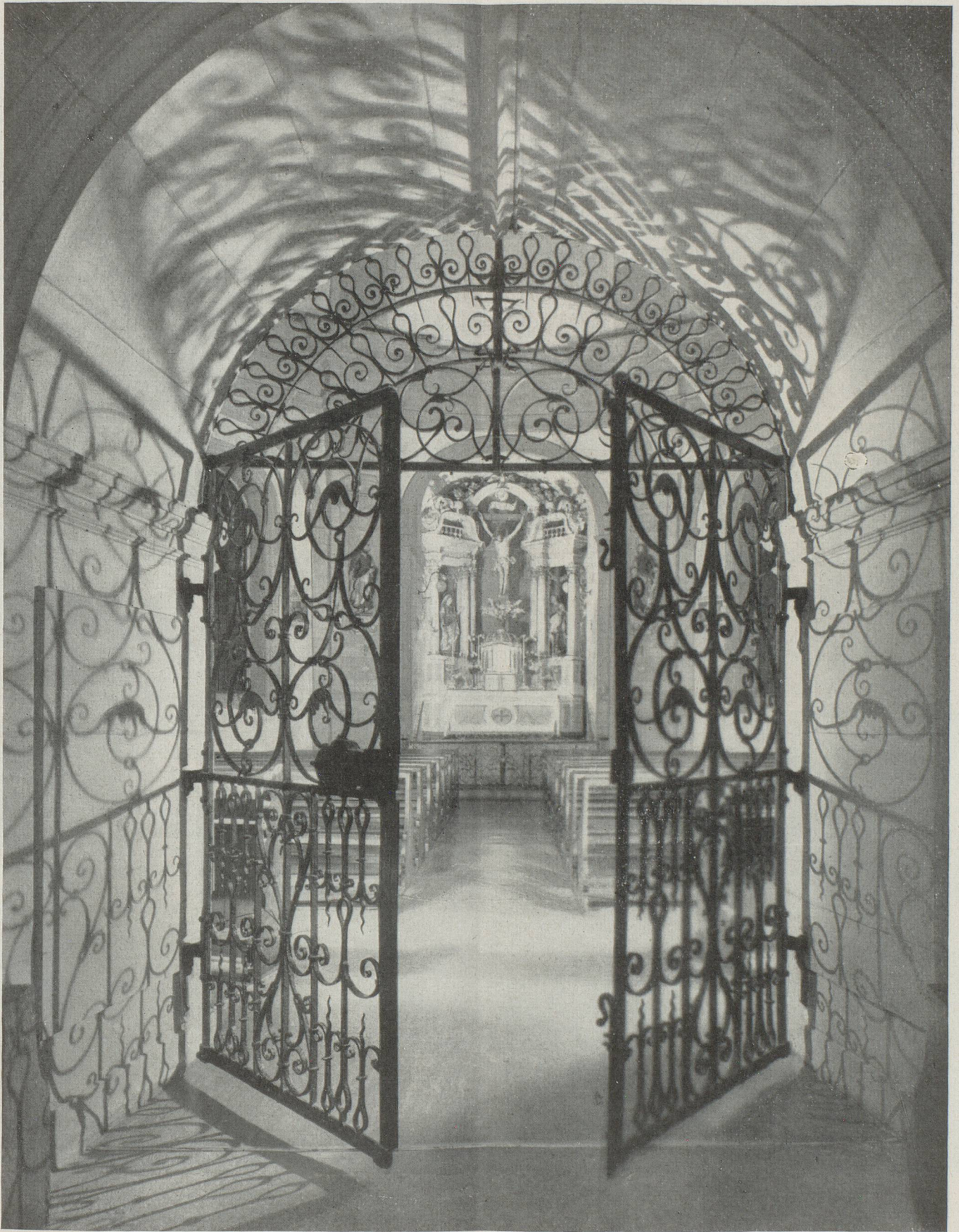
L'Eglise de l'Hôpital des Bourgeois