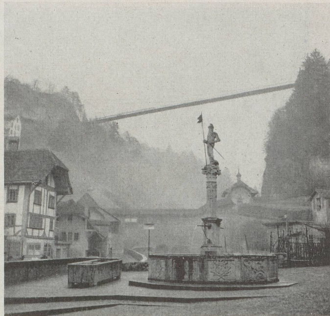
La fontaine de la Fidélité, place de la Balme

Le système se complétait à l'Ouest par la grand-place de Champagne, une foire permanente, qui passait de ville en ville et par les « chemins qui marchent » de la