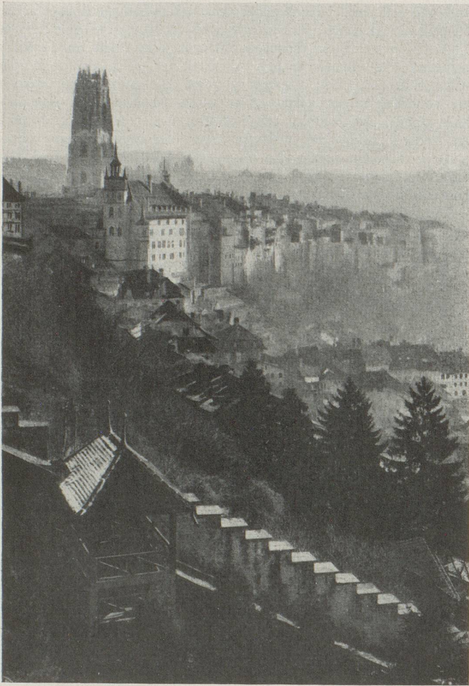
Fribourg vue de l'Ouest ; au premier plan, le rempart du funiculaire.