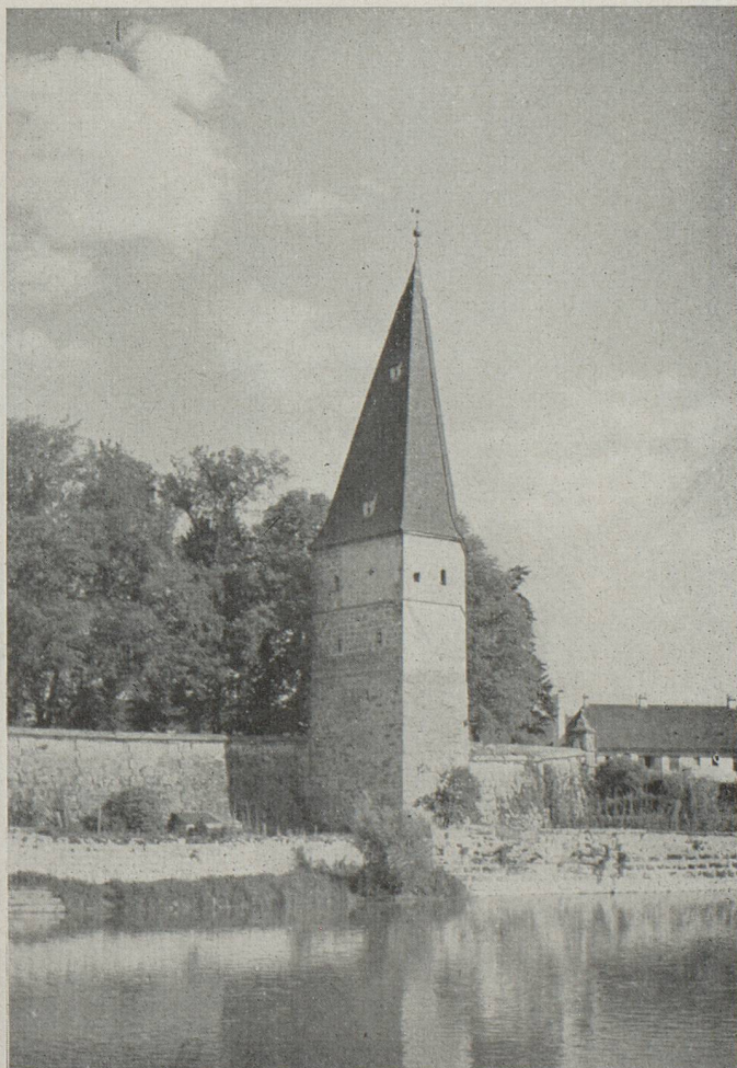
Der Krumme Turm