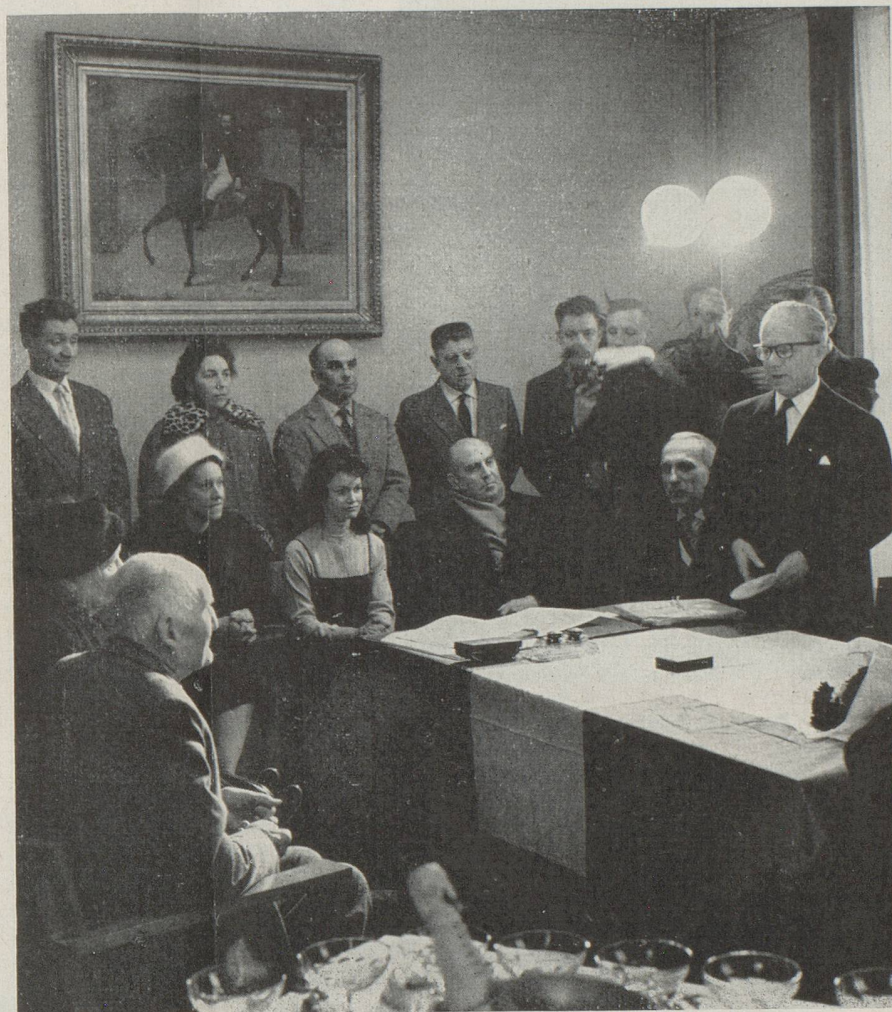
Pendant l'allocution de l'Ambassadeur de Suisse.