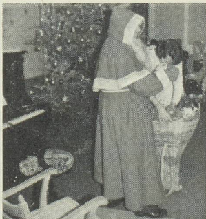
Le Père Noël dans la chaude ambiance familiale du «Home»