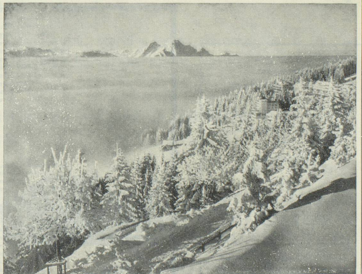
Une excursion dans le radieux soleil hivernal du Righi est toujours un événement inoubliable pour les hôtes du «Home»

C'est pour cette raison que nous nous faisons un plaisir de vous informer qu'exceptionnellement, pour ce beau séjour d'hiver, nous sommes en mesure d'accorder un rabais spécial d'hiver de 10 à 30% sur les tarifs du «Home».