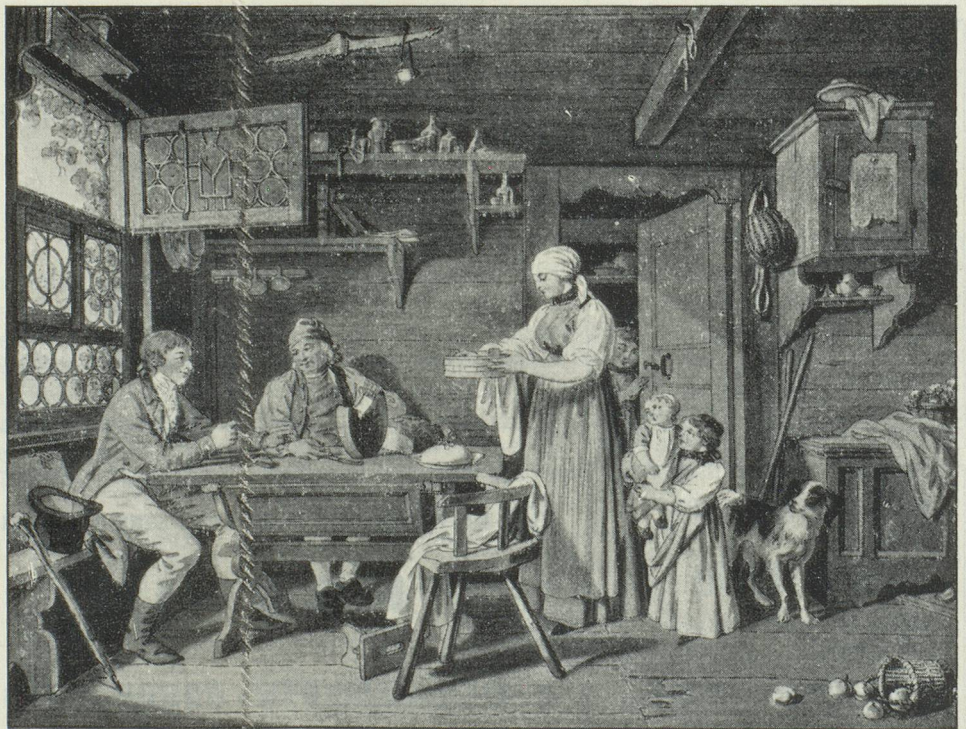
Sigmund Freudenberger, Bern, 1745—1801