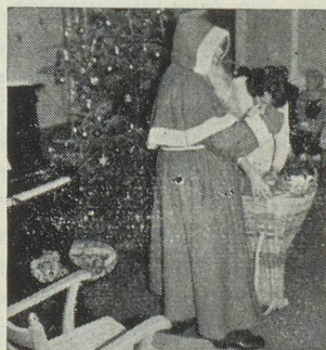
Le Père Noël dans la chaude ambiance familiale du «Home»