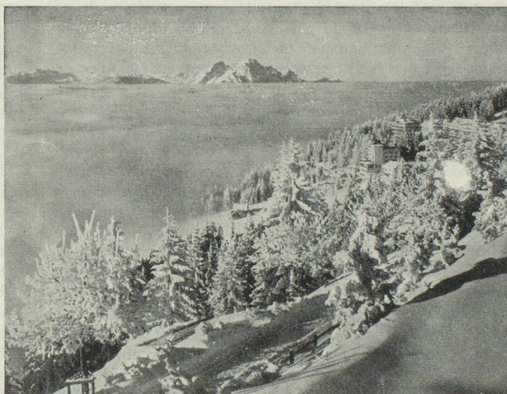
Une excursion dans le radieux soleil hivernal du Righl est toujours un événement inoubliable pour les hôtes du «Home»

Ecrivez au Secrétariat du «Home» pour Suisses de l'étranger à Dürrenäsch (Argovie/Suisse) en demandant sans aucun engagement de votre part et gratuitement les formules d'admission avec conditions, etc., ou encore adressez-vous à votre consulat ou à votre Société suisse.