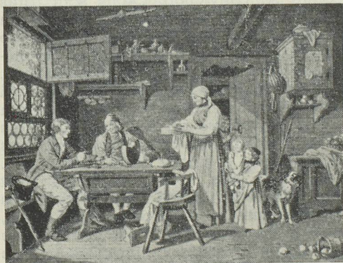
Sigmund Freudenberger, Berne, 1745-1801 Hospitalité. Gravure en couleur, Musée des Beaux-Arts à Bâle.