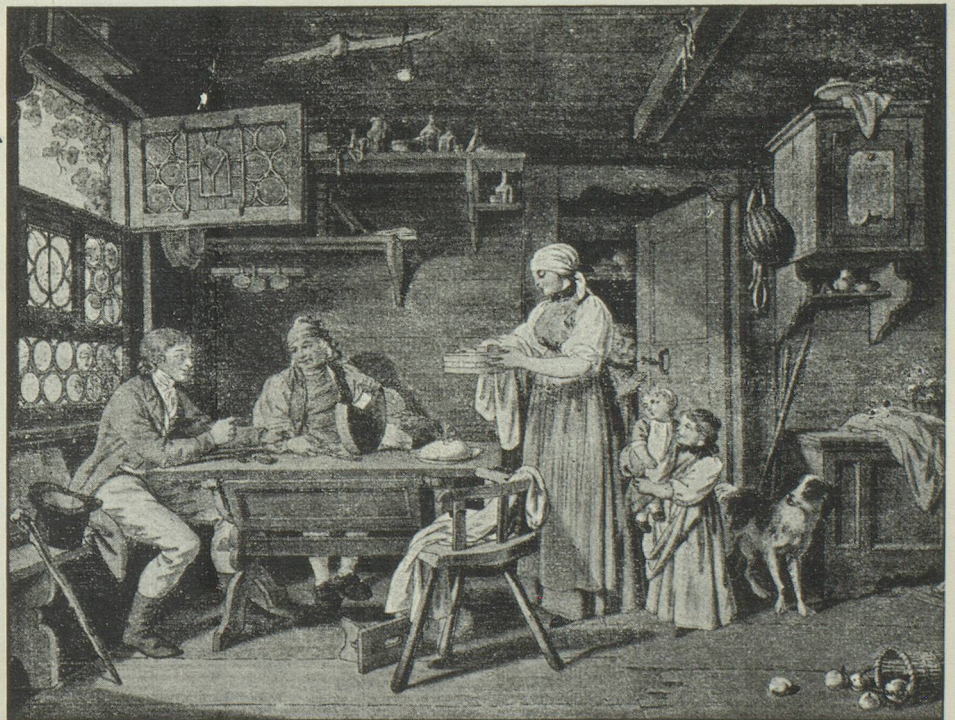
Sigmund Freudenberger, Bern, 1745—1801