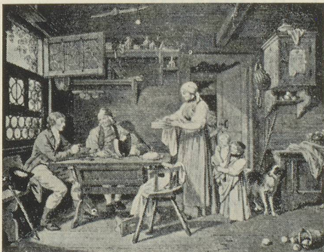
Sigmund Freudenberger, Berne 1745—1801 Hospitalité