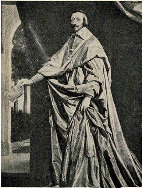
Le cardinal de Richelieu par Philippe de Champaigne (Londres, National Gallery)