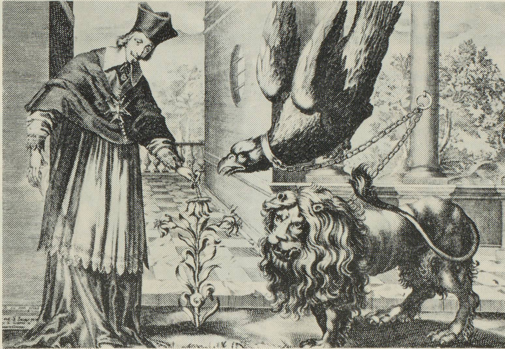
Emblème sur l'extirpation de l'hérésie et de la rébellion par les soins du cardinal de Richelieu. Le ministre de Louis XIII arrache les épines qui poussent dans les fleurs de lys. Il tient enchaînés le lion d'Espagne et l'aigle de l'Empire.