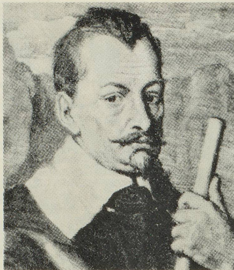
Albert de Wallenstein (1563-1634)

Différence de « climats », de méthodes, importante leçon de choses, que cette rencontre du prélat aux origines presque bourgeoises, dénué de toutes les qualités féodales (santé, prestance, courage physique, prestigieuse apparence, aptitude aux exercices), qui sans