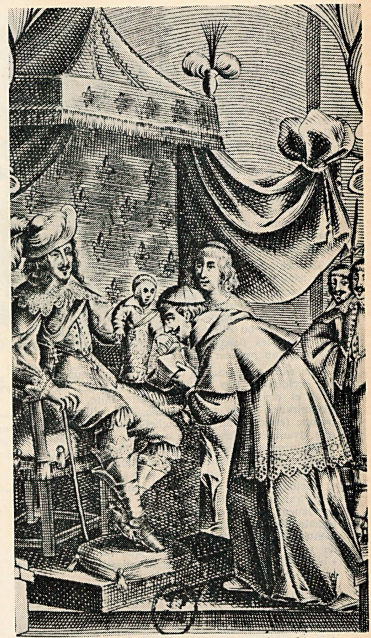
Monseigneur le Dauphin est visité par le cardinal de Richelieu à son retour de Picardie.