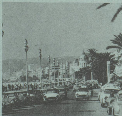
4, avenue Georges-Clemenceau. Tél. : 88-85-09 - 88-54-76.