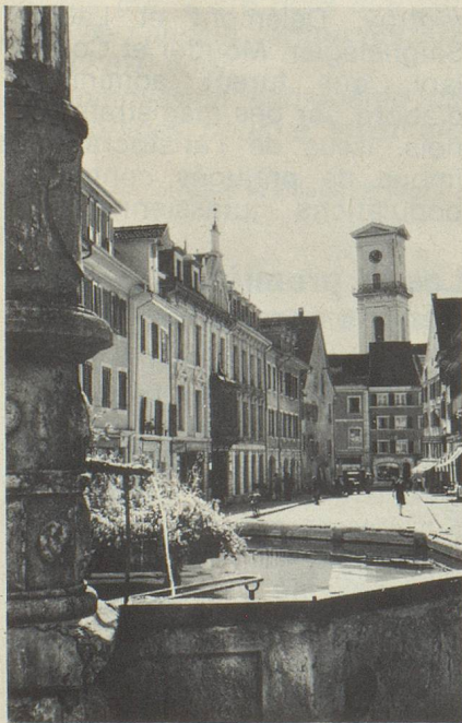
La fontaine de Delémont

Mais, au point de vue politique, les citoyens se plaignaient de n'avoir aucun droit: le Grand Conseil ne comptait que peu de représentants du peuple et les charges publiques étaient presque toutes attribuées aux membres de l'aristocratie bernoise.