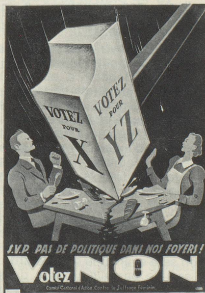
Affiche contre le suffrage féminin (1935).

Dans le camp de l'opposition on alléguait encore souvent qu'il fallait éviter d'abandonner les femmes à la concurrence sans merci de la politique et des affaires sociales, concurrence dans laquelle elles devraient se maintenir égales mais opposées à l'homme et en tout état de cause moins bien armées. A l'appui de ces arguments et pour illustrer les faiblesses de la femme on mentionna essentiellement sa passivité naturelle ainsi que son manque de sens des décisions. Bref, l'on supposait d'emblée la femme inapte à la compétition de la vie politique.