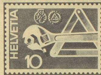
TCS/ACS, Secours routier.