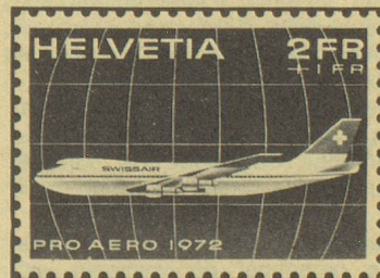
Timbre spécial «Pro Aero», avec supplément de prix.