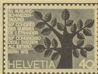
50 e Congrès des Suisses de l'étranger. Œuvre du graphiste bâlois Celestino Piatti, ce timbre représente un tronc d'arbre nouveau, duquel partent dans différentes directions cinq branches portant ensemble 22 feuilles. Les branches symbolisent les cinq continents, et les feuilles les cantons suisses.