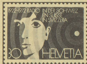
50 e anniversaire de la radio en Suisse, 1922-1972.