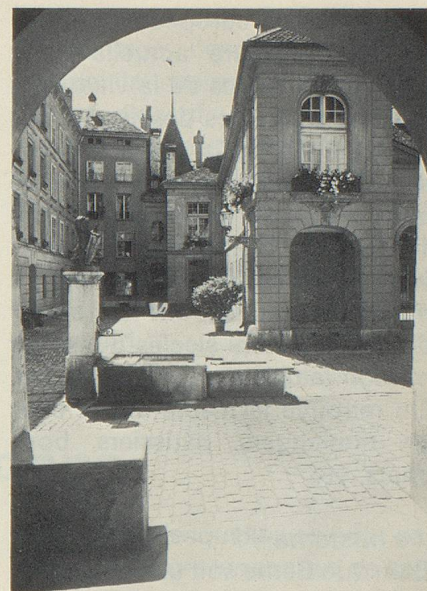
Berne à la française.

L'ancien régime des familles patriciennes a conféré à la ville de Berne un cachet élégant, qu'elle a su conserver en plein 20 e siècle. Les relations étroites de ces familles avec la France, où leurs fils servaient régulièrement comme officiers dans la garde du roi, ont laissé un goût très prononcé pour la culture française. Quoique la ville se trouve bien sur territoire de langue suisse-alsacienne, le français y est parlé couramment, ce qui donne parfois lieu à un curieux mélange, tout comme en Alsace. On entend fréquemment des tournures telles que «guete bonjour», et «merci» et «s'il vous plaît» remplacent les «danke» et les «bitte». Il y a quelques lustres on pouvait encore voir le nom des rues en deux langues: la «rue des chaudronniers» par exemple côtoyait la «Kesslergasse». La descendance