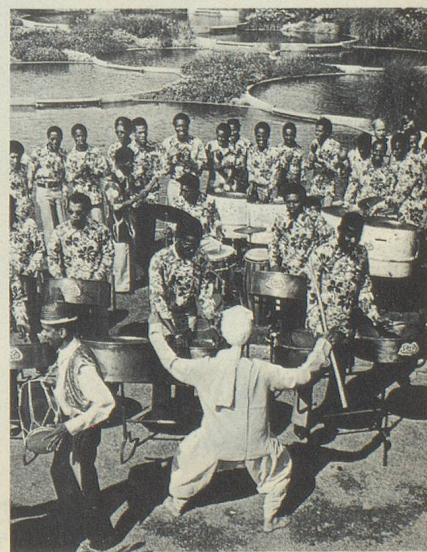
Musiciens et danseurs de Trinidad au 53 e Comptoir suisse.

Les citoyens obwaldiens, de leur côté, disent enfin oui au suffrage féminin par 1485 voix contre 1044. Enfin à Neuchâtel le peuple refuse par 12 597 voix contre 10 452 d'allouer chaque année un subside cantonal minimum pour l'aide aux pays en voie de développement.