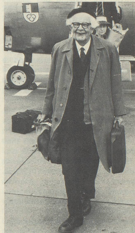
Le psychologue suisse Jean Piaget.

naie. Stabilisation du marché de la construction: 724819 oui, 154805 non. Sauvegarde de la monnaie: 808683 oui, 113314 non. Le pourcentage des votants, 25,8%, a été un des plus faibles jamais enregistrés.