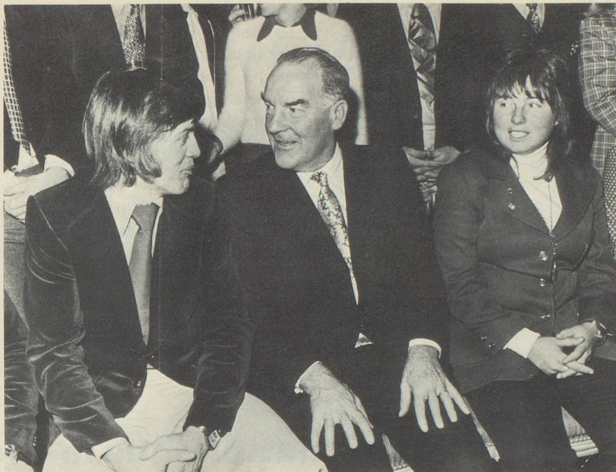
Le conseiller fédéral M. Gnägi a reçu au début décembre nos héros sportifs. On le reconnaît entouré de M.-T. Nadig et de B. Russi.

L'accord de libre-échange avec la CEE est accepté par tous les can-